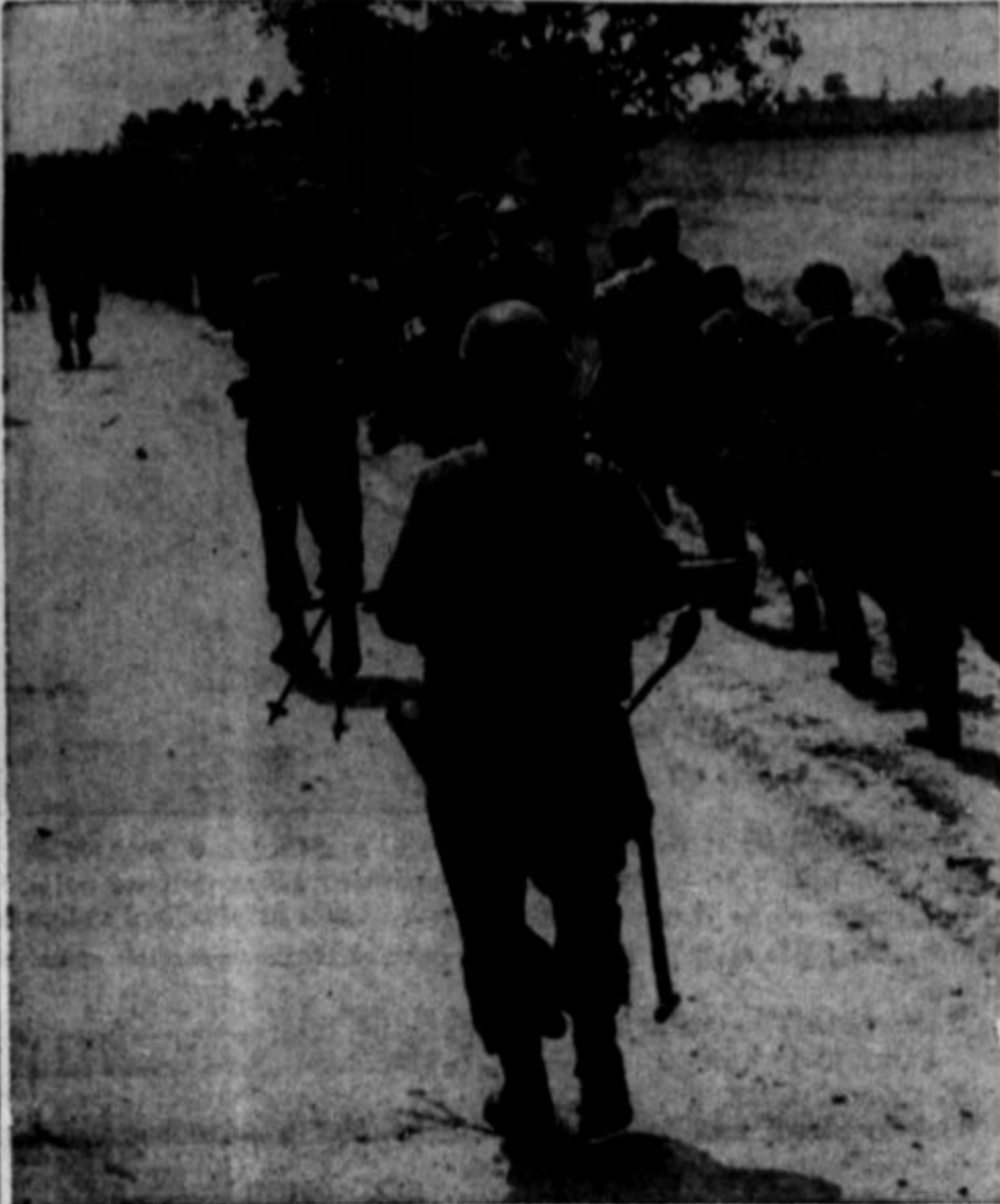
"NADLJUDJE", ujeti v Normandiji, na poti v jetniški tabor v Angliji.

je tista poročila ameriških novinarjev pustila v svet. A v Zedinjenih državah je nekdo na visokem mestu podrezal v Rim in nadškof Spellman je poklical zavezniške novinarje skupaj in jim izjavil, da s svetim očetom s katerim se je pomenkoval dve in pol ure, nista govorila o miru. "O čem pa?" so ga vprašali. "O, podal sem mu poročilo o cerkvenih zadevah v Ameriki." Če bi bilo to res, ali je treba za take navadne reči potovati v teh časih v Rim? Mož je imel za ta poset na razpolago ameriško vojno letalo, telesno spremstvo ameriške oborožene sile in stroške pa mu plačala ameriška vlada.