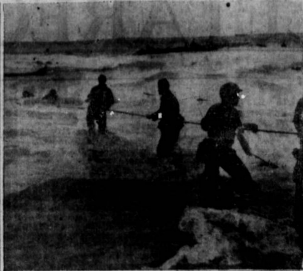
VSAAK CAS ga lahko kdo zadene. Tako si je mislil vsak vojak, ki je prišel v Francijo. General Eisenhower jim je dejal, da mora postati Normandija njihova in dogodilo se je. Hitler je ni mogel ubraniti. Gor-nje je slika iz invazije v Francijo.