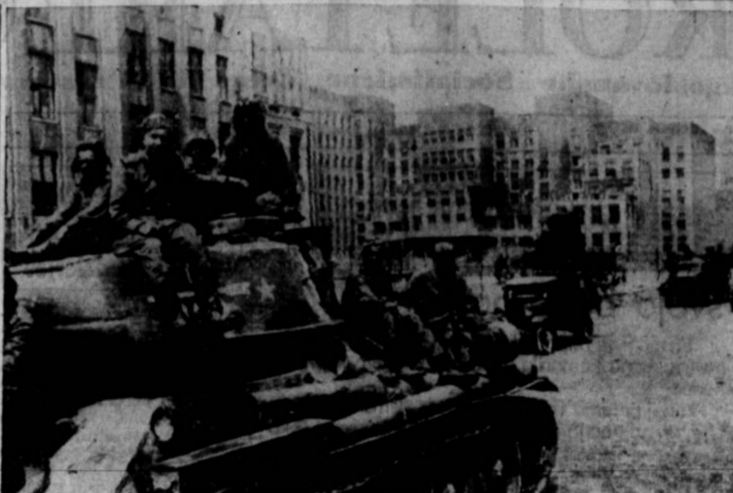
MINSK, KI GA JE V TEJ VOJNI OSVOJILA RDEČA ARMADA, prehaja v normalno stanje. Velik del Minska, ki je glavno mesto Bele Rusije, so Nemci porušili, a hiš, ki so na gornji sliki, niso utegnili razdejati.

V vojnah le on krvavi in strada ter umira. V normalnih časih mora delati za druge v plačilo za bori vsakdanji kruh. Ko dela ni,