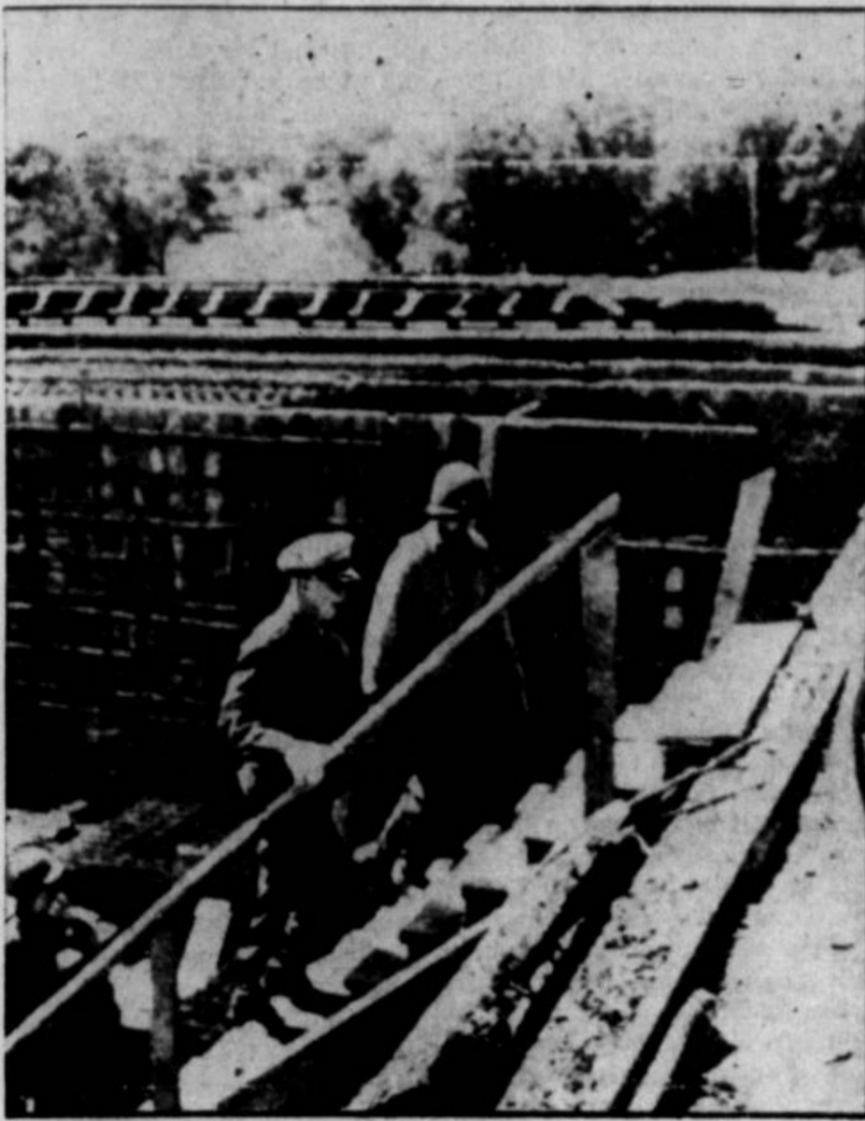
ZAKLONISČE ZA "ROBOTE". — Američani so z invazijo v Francijo zasegli še nedodelano nemško zaklonišče, s katerega bi spuščali "robote" na našo armado v Angliji in na angleška mesta. Naprave so zavzemale ogromen prostor. Kje so druga nacijska vzletišča za bombne robote, se zavezniškim letalcem še ni posrečilo točno dognati.