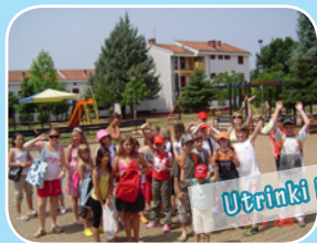
Utrinki iz letovanja

VIRC Poreč je letovišče za otroke in mladino in je letos praznoval 20-letnico delovanja. Med počitniško sezono je namenjen letovanju otrok iz Maribora in širše okolice, izven sezone pa