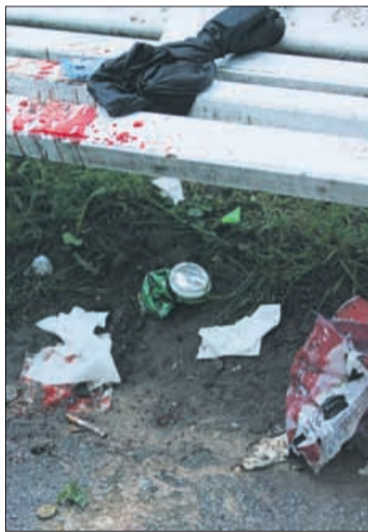
Klop za počivanje

sti. Skupaj s tržnimi inšpektorji so namreč nadzorovali tudi prodajo alkohola mladostnikom. Tako bodo kaznovali eno izmed večjih trgovin na Ljubljanski cesti, kjer so mladostnikom prijazno prodali alkohol. Denarna kazen bo doletela tudi natararja in lastnika enega izmed celjskih gostinskih lokalov - iz istega razloga. Plačilni nalog pa so napisali vozniku, ki se je po mestnem parku vozil kar z osebnim avtomobilom. Medtem ko je vsako leto med mladimi, ki se ob koncu