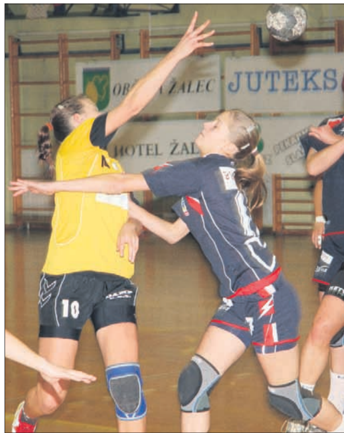
Žalčanke (v rumenih dresih) so osvojile četrto, Celjanke (v modrih majicah) pa so se končale na 4. mestu.