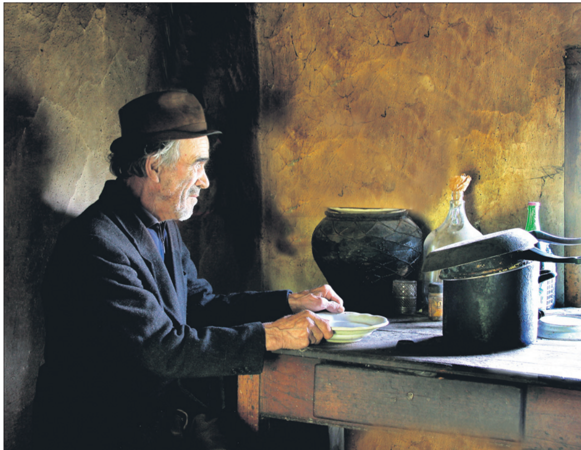
Ena od Čatrovih velikokrat nagrajenih fotografij.