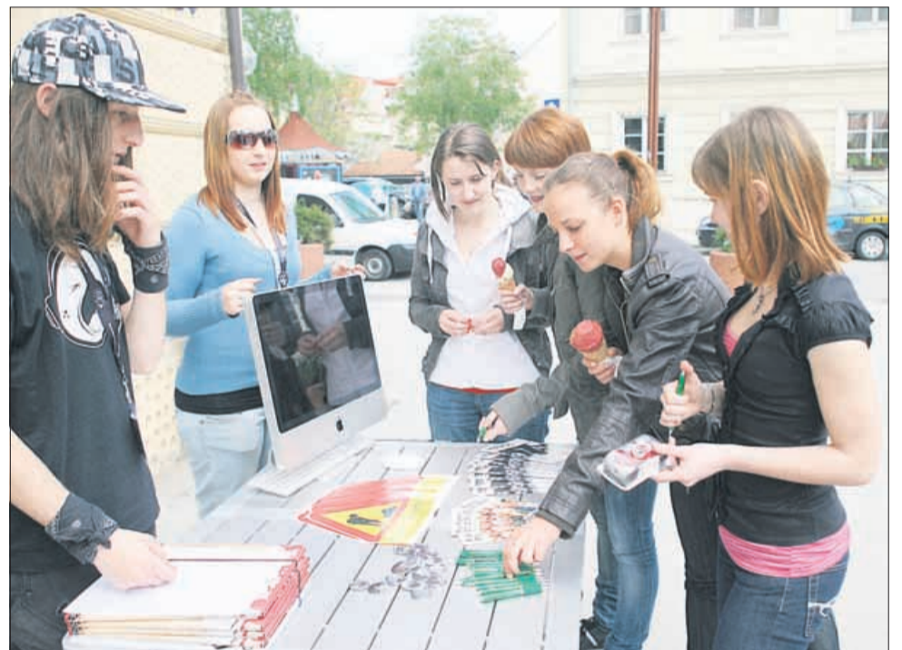
Dober odziv dijakov na Street fokus

Strokovna žirija, ki jo bodo sestavljali mentorji poletne fotografske delavnice Celje fokus, bo izmed vseh posnetih fotografij izbrala tri najboljše. Te bodo julija razstavljene v Galeriji Pelikanovega stolpa na celjskem Starem gradu. BS