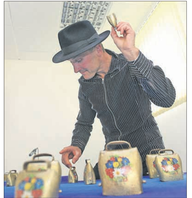
Ne, to ni eksotično ustvarjanje zvokov, temveč plod večletnega posvečanja glasbi in izjemnega poslušanja zanjo.