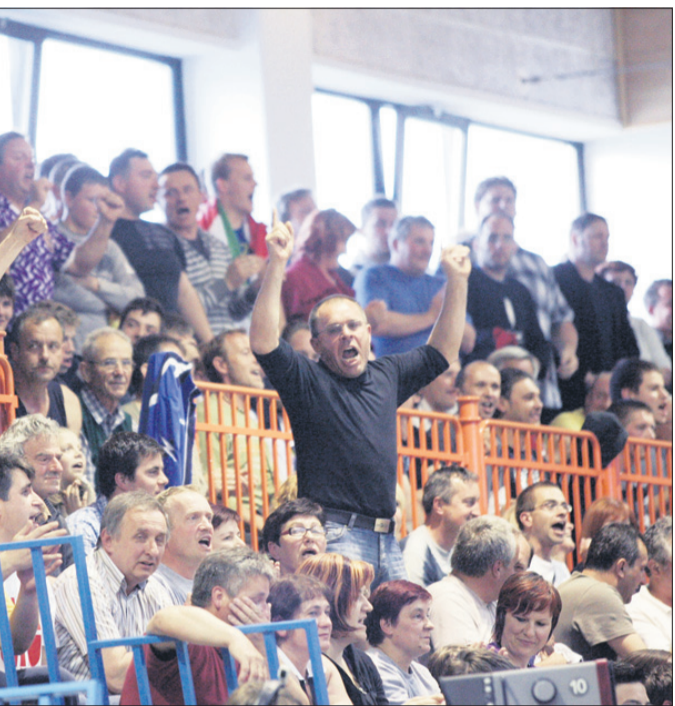
rski navijači v nabito polni dvorani Hruševac

cej utrujeni, ker smo odigrali serijo 16 tekem ob sredah in sobotah. Uspeli smo vključiti tudi nekaj mladih igralcev, prišli smo v polfinale in proti Olimpiji se nismo osramotili, tako da je vse super,« je Novakovič omenjal tudi sodniški kriterij, ki je bil prevečkrat