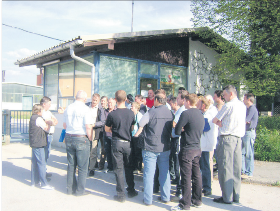
Delavci so nestrpni. Dokler se ne vložijo predlog za stečajni postopek, nimajo pravice zahtevati denar iz stečajne mase oz. jamstvenega sklada.