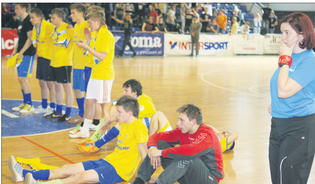
Pred številnimi gledalci so dijaki ekonomske šole v finalu proti Novomeščanom izgubili šole po izvajanju šestmetrovk.