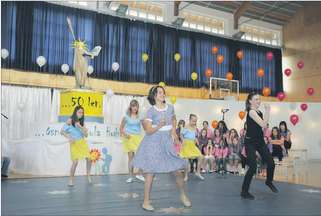
Na četrtkovi osrednji slovesnosti so se učenci OŠ Hudinja spomnili nekaterih dogodkov iz bogate zgodovine šole, hkrati pa so svoj pogled zazrli tudi v prihodnost. Med gosti je bil tudi šolski minister dr. Igor Lukšič.