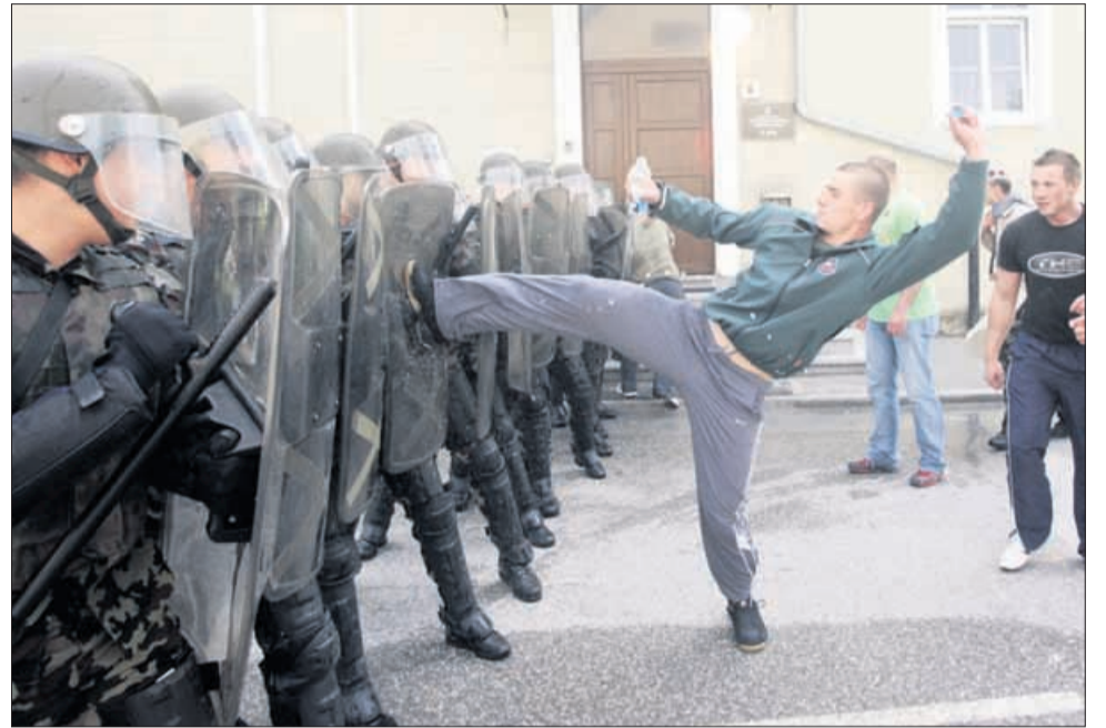
Na celjskem dnevu odprtih vrat so prikazali tudi postopke pri vzdrževanju javnega reda in miru.