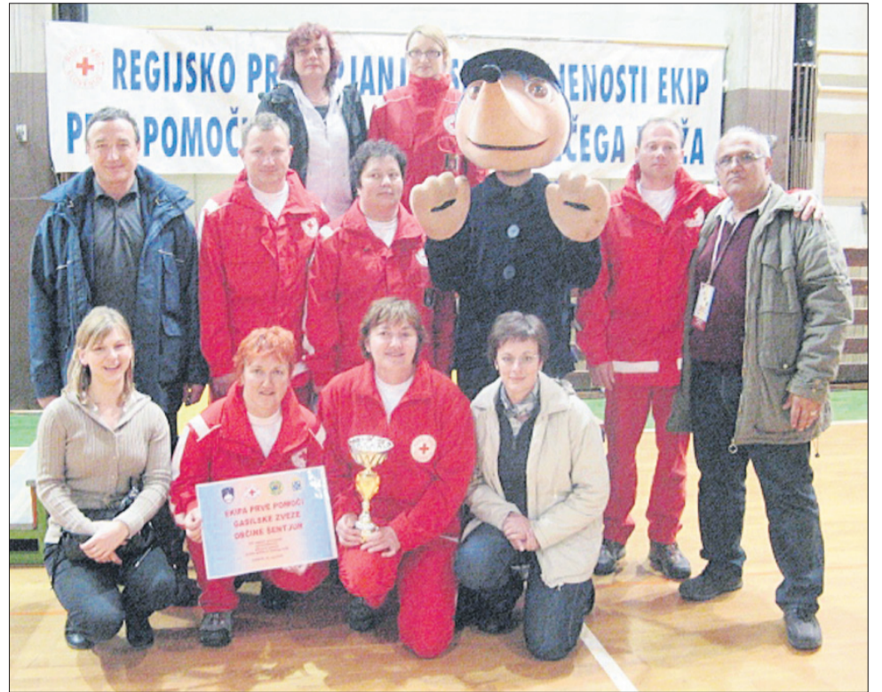
Med 15 ekipami so se najbolje odrezali Šentjurčani.