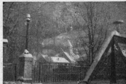
LASKO — STARO LETO V NOVEM SNEGU

načrtu idejno nakazana, bo treba še izdelati glavni projekt nato pa pričeti postopoma z gradnjo.