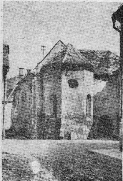
SEDANJE STANJE CELJSKE ŠPITALSKE CERKVE NA SLOMSKOVEM TRGU 5

Leta 1763 je umrl baron Franc Anton Moscon; bil je zadnji lastnik gradu Planina iz Mosconovega rodu. Njegovi dediči so čez 6 let prodali