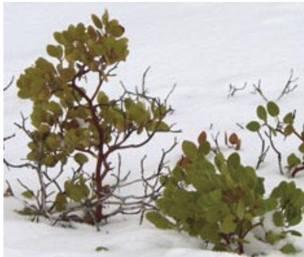
Slika 8: Manzanita v snegu februarja 2008.

V parku je skupno okrog 80 km raznih poti - od tega 29 km cest, ki vodijo do 13 razglednih točk. Leta 2002 so v parku v poletnem času uvedli javni prevoz, leta 2004 pa so začeli posodabljati zastarelo cestno infrastrukturo (11). Posebej so označene pešpoti, po katerih hoja traja manj kot en dan, dve pa sta dvodnevni. Jasno je, da nekatere od njih zahtevajo pozimi ustrezno zimsko obutev, poleti pa ju nujno poskrbeti za zadostne količine pitne vode. Pozimi je v parku možno smučanje na urejenih in neurejenih progah v skupni dolžini 32 km. Kot posebnost omenjamo tudi opazovanje zvezd. V parku je namreč zelo čist zrak, tako da lahko vidimo 140 km daleč v Arizono, ob posebno jasnih dnevih pa celo neverjetnih 320 km. Nočno nebo ima magnitudo 7.3, kar pomeni, da je eno najbolj temnih v Severni