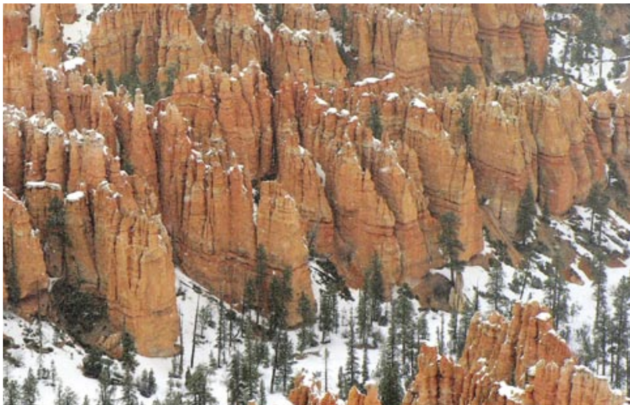
Slika 5: Huduji na različnih stopnjah oblikovanosti.

Večina hudujev je nastala v rožnatem členu ( Pink Member ) formacije Claron , ki jo gradi v glavnem mehak in neodporen apnenec. Huduje oblikujeta zlasti zmrzal, ki je v Bryceovem kanjonu prisotna v okrog 200 dnevih, in v manjši meri delovanje tekoče vode. Zmrzal veča in širi razpoke, deževnica, ki vsebuje ogljikovo kislino pa kemično raztaplja apnenec. Zmrzal hitreje deluje zlasti na navpične razpoke, ki so že naravno prisotni v tem apnencu. Kemično preperevanje zaobli robove stolpičev in jim da kepast ali kopast videz. Na kemično preperevanje so bolj odporne vmesne plasti muljevca in meljevca, zlasti pa so pred erozijo zaščiteni tisti huduji, ki imajo vrhnji del iz bolj odpornega dolomita.