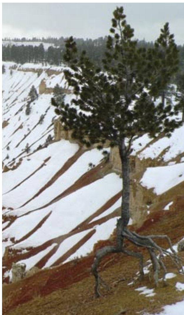
Slika 7: Bryce Canyon porašča v vrhnjem delu ekstenzivni jelovoborov gozd. Bor z razgaljenimi koreninami dokazuje močno preperevanje in hitro umikanje pobočja.

Med drugimi rastlinami velja omeniti 5 do 7 cm visok endemit iz družine lopatic Bryce Canyon Paintbrush ( Castilleja revealii ), soroden in zaščiten wayominški ali ozkolistni čopič ( Castilleja linariifolia ), ogroženo skalno orlico ( Aquilegia scopulorum ) in zelo redko ploščato penstemono ( Penstemon bracteatus ).