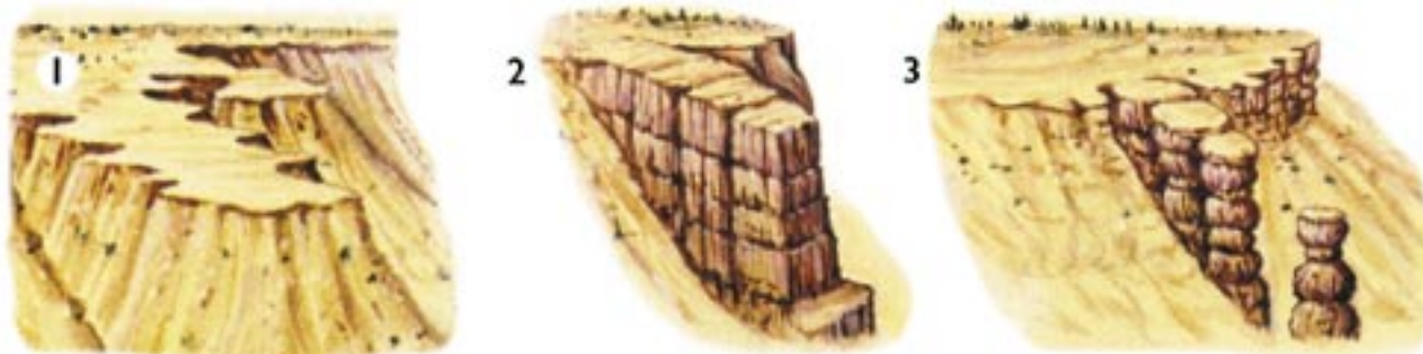
Slika 4: Nastanek hudujev: od uravnave, preko pomola ali plavuti ( fin ) do okna v steni in stolpičev ( hoodoo ). Zaporedje vidimo tudi na sliki 5 od desne proti levi (5).

oblikovala obširna poplavna ravnica. Blato in pesek sta se sprijela v zeleni peščenjak in meljevec formacije Kaiparowits . Formacija je v Bryceovem kanjonu debela 30 m ( Canaan Peak , Pine Hollow ), drugod pa še bistveno več. Ob prehodu v paleocen sta začela nastajati še konglomerat in peščenjak.