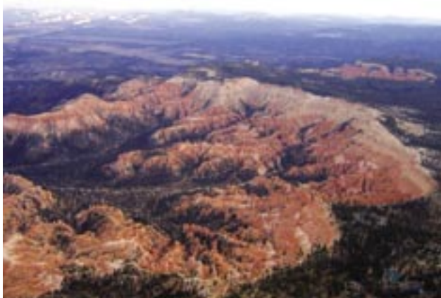
Slika 1: Šele pogled iz zraka nam pokaže pravo obliko Bryceovega kanjona in njegov erozijsko-denudacijski nastanek (7).

Sledile so manjše skupine mormonov in skušale poseliti območje vzhodno od kanjona Bryce vzdolž reke Paria River. Leta 1873 je tam začela rediti govedo družba Kanarra Cattle Company.