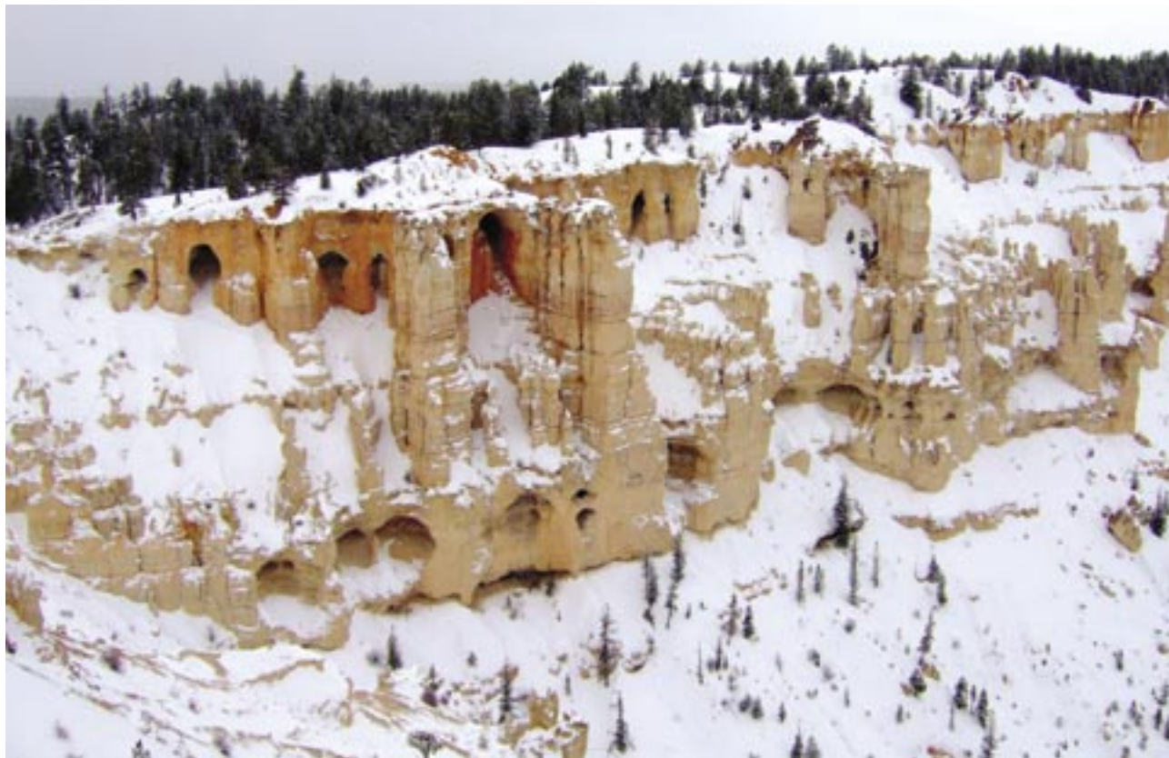
Slika 6: Jame (spodjede) na robu Brycovega kanjona so delo preperavanja in kemičnega raztapljanja v različno odpornih kamninah.

Poleg kemičnega delovanja je voda pomembna tudi za odnašanje preperine in dolbenje tesni ali sotesk med vrstami hudujev, ki jih s tem dodatno razgali ali loči od drugih. Soteske nastajajo v glavnem med skalnimi pomoli v obliki ribje plavuti (angl. fin), kjer lahko voda sproti odnaša preperelo gradivo in nato še dodatno pogloblja strugo. Zlasti poleti so močni nalivi tipa monsunskih neviht, ki v veliki meri odnesejo preperel material v reko Pario in njene pritoke.