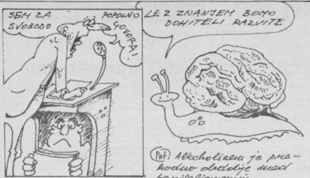
(Pet) Alkoholizmu je prva - hodno oledenje med kapitalizmom in .....