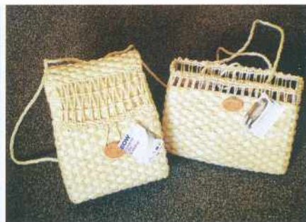
Prekmurski cekarji v vlogi konferenčnih torbic in nahrbtnikov za evropsko konferenco o vidri 2008