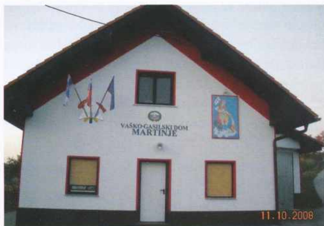
Pogled na obnovljen gasilski dom v Martinju

V poletnih mesecih smo poskrbeli za urejenost in vzdrževanje gasilskega doma. V notranjosti gasilskega doma smo namestili polico za pokale in uredili prostor za kavni avtomat. Na tem mestu bi se še posebno radi zahvalili Dejanu Šinku za vso materialno pomoč in medsebojno sodelovanje. Upamo, da bomo tudi v prihodnje lepo sodelovali.