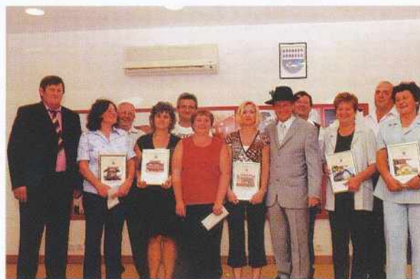
Nagrajenci projekta Moja dežela - lepa in gostoljubna