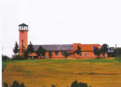
Obnovljeni gasilski dom v Križevcih

1908 leta je bila ustanovljena prostovoljna gasilska četa v Križevcih v Prekmurju, ki je bila takrat ena izmed prvih v širši okolici. Ustanovili so jo zaradi potreb po pomoči pri požarih in reševanju ljudi in živali ob različnih nesrečah. Ta