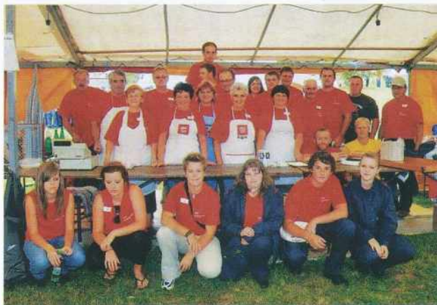
Vaščani Šulincev so se v velikem številu aktivirali pri pripravi občinskega gasilskega tekmovanja

30. 08. 2008 se je v Šulincih odvijalo občinsko gasilsko tekmovanje Gasilske zveze Gornji Petrovci. Domačini so poskrbeli za odlično organizacijo in dobro počutje tekmovalnih desetini.