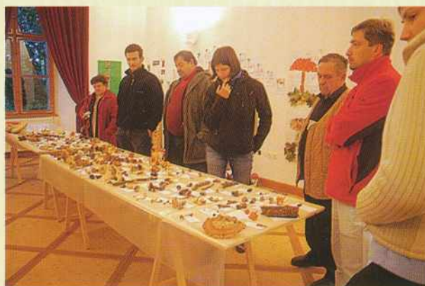
Mikološko srečanje, razstava gliv

Naslednje druženje bo spet čez 2 leti, dotlej pa upamo, da bomo uspeli urediti tudi zakonodajne temelje na temo nabiranja gob in gozdnih sadežev ter morda začeli z raziskavo gobonosnosti goriških gozdov. Srečanje se je zaključilo z vodstvom po razstavi gob iz Goriškega, ki je bila postavljena v okviru 3. mednarodnega srečanja mikologov na Goričkem.