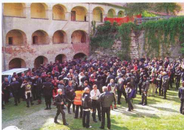
Motoristi na gradu Grad

spremljali policisti na motorjih tako, da je bilo za varnost poskrbljeno. V popoldanskih in večernih urah so motoristi in drugi obiskovalci uživali v dobri glasbi, saj so nastopili številni ansambli. Poleg tega je bila pestra ponudba spremljajočih vsebin, kot so: tetovaže, motoristična oprema, majice, usnjeni izdelki, nakit in druge drobnarije. Nekateri so se zabavali na biku, drugi pa so si ogledovali številne motorje. Najbolj vztrajni pa so dočakali tudi že tradicionalni streaptease v nočnih urah. Skratka, veselo vzdušje se je nadaljevalo do samega jutra. Mnogi motoristi so prespali kar v šotorih v kampu, ki ga uredimo za njih, nekateri pa so se podali po bližnjih kmečkih turizmih in gostiščih. Letos so bili prav vsi zadovoljni, tako obiskoval-