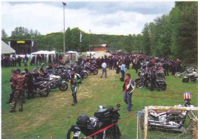
Motoristi v Križevcih

VIII. mednarodno srečanje motoristov v Križevcih se je letos odvijalo 02. in 03. maja. Za razliko od prejšnjih let, je bilo letos čudovito sončno vreme, ki je privabilo veliko število motoristov iz cele Slove-