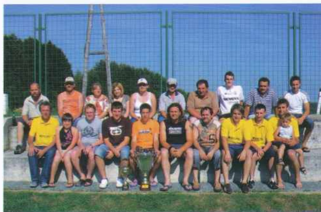
Občinski turnir v malem nogometu v Martinju, 06.07.2008