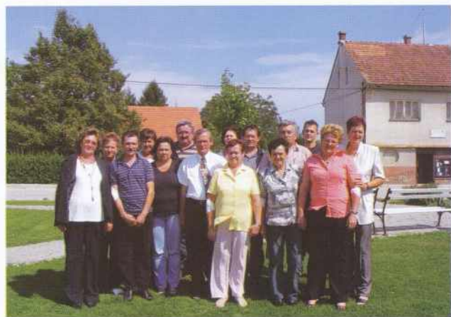
Krvodajalci KORK Gornji Petrovci, 04.09.2008