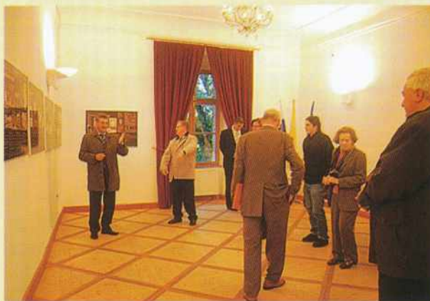
Otvoritev razstave »Vsem Slovencem«