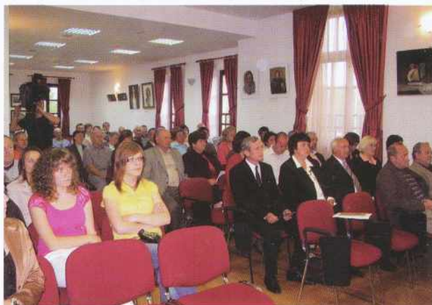
Proslava je privabila kar veliko število gostov

V prijetnem okolju novega Kulturnega doma Občine Gornji Petrovci v Stanjevcih smo v soboto, 24. maja 2008 počastili spomin na 500. letnico rojstva Primoža