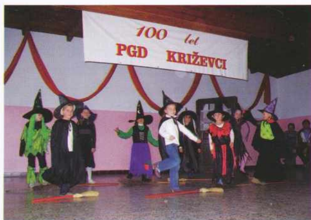
Nastop najmlajših učenk OŠ Gornji Petrovci