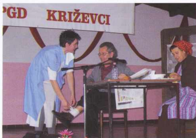
Nastop KUG Goričko