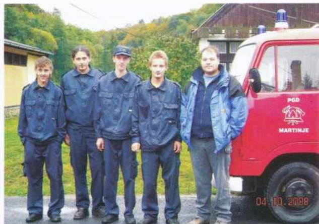
Nekaj članov PGD Martinja na Gornjem Seniku

v tekmovalnem duhu. Udeležili smo se sektorskega gasilskega tekmovanja, na katerem smo članice dosegle 1. mesto, člani pa 5. Na občinskem gasilskem tekmovanju smo članice prav tako dosegle 1. mesto, člani pa 8. mesto. Čestitamo!