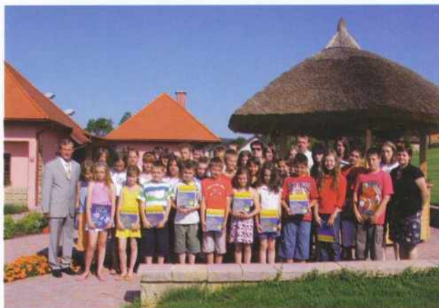
Sprejem odličnjakov pri županu v Kulturnem domu Občine Gornji Petrovci v Stanjevcih