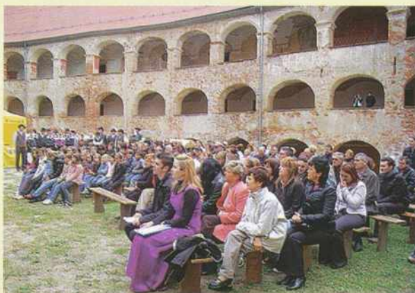
800 obletnica prve omembe posestva Lyndwa

Grajska vrata so bila na dan prireditve odprta za vse obiskovalce brez vstopnine. Po slavnostni prireditvi si je bilo na grajskem dvorišču moč ogledati kulinarčno prodajno razstavo, na kateri je bilo mogoče poskusiti domače goričke kulinarčne dobrote in vina.