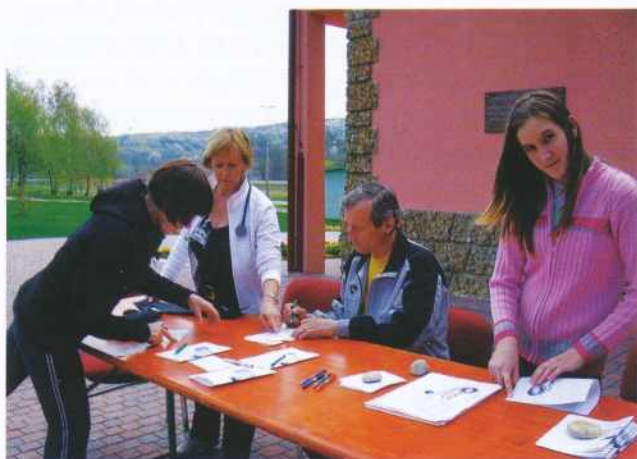
Nasveti zdravnice in med. sestre pred startom

Ob koncu prvega projekta Živimo zdravo, ki se je v naši občini izvajal od novembra 2004 do aprila 2005, se je testa telesne zmogljivosti udeležilo kar 60 občank in občanov. Le tri leta pozneje, v nedeljo, 13. aprila 2008 pa se je, žal, podobnega