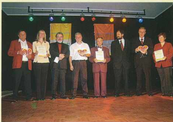
Nagrajenci 2. Majske pesmi

Maloštevilna publika je uživala ob čudovitem nastopu tolkalcev, ki so sodeč po izrazu na obrazih, uživali med izvajanjem v historičnem okolju grajskega dvorišča. Pesem v maju je pri Gradu odmevala letos že drugič in verjamemo, da bomo tovrstne prireditve organizirali tudi naslednje leto.