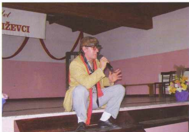
Starejše občane je zabaval naš znani glasbenik, Franc Gorza