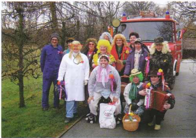
Pustni pohod po Gornjih Petrovcih, 03.02.2008

TD Vrtanek je začrtalo svoje aktivnosti v letu 2008 na letnem občnem zboru, ki je bil 20. januarja v gostilni pri Benciku. Kot vsako leto, smo tudi letos izpeljali vse zadane naloge. Tako smo se že 26. januarja 2008 na povabilo Goriškega društva za lepše vütro in Krajinskega parka Goričko odzvali k sodelovanju na vsakoletnem sejmu Turizem in prosti čas v Ljubljani. Koncept predstavitve je