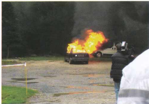
Prikaz požara in gašenja na Madžarskem

Kot aktivne članice in člani smo se preizkusili tudi