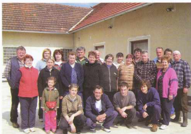
Čistilna akcija v Gornjih Petrovcih

Ob svetovnem dnevu Zemlje je dne, 19 aprila 2008 Občina Gornji Petrovci, v sodelovanju s krajevnimi skupnostmi, ponovno pripravila čistilne akcije po posameznih vaseh. Kot opazamo že vrsto let, se čistilnih akcij udeležujejo vedno isti občani, ki čutijo zavest, da mora biti naše okolje urejeno in čisto, pa čeprav niso oni tisti, ki so odvrgli smeti v naravo. Tisti občani, ki v resnici onesnažujejo