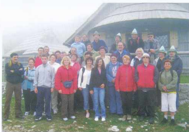
Člani TD Vrtanek na izletu na Veliki planini, 31.08.2008

gali PGD Gornji Petrovci, pekli pecivo za različne potrebe domače občine in potrebe SKS Rakičan, sodelovali na prireditvah občinskega praznika. V jesenskem delu smo pripravili martinovanje za