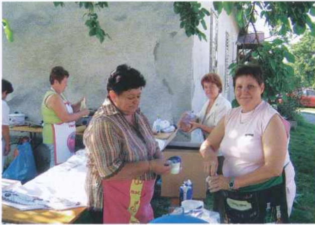
Priprava langašev na sejmu Buča pri Nedeli, 01.06.2008

15. marca smo proslavili dan žena in materinski