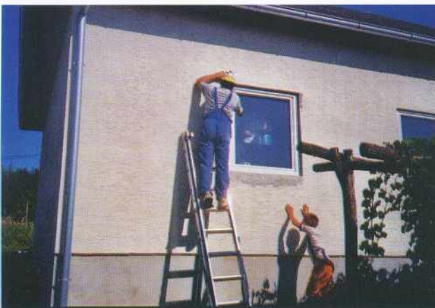
Zamenjava oken na vaško - gasilskem domu na Kukeču