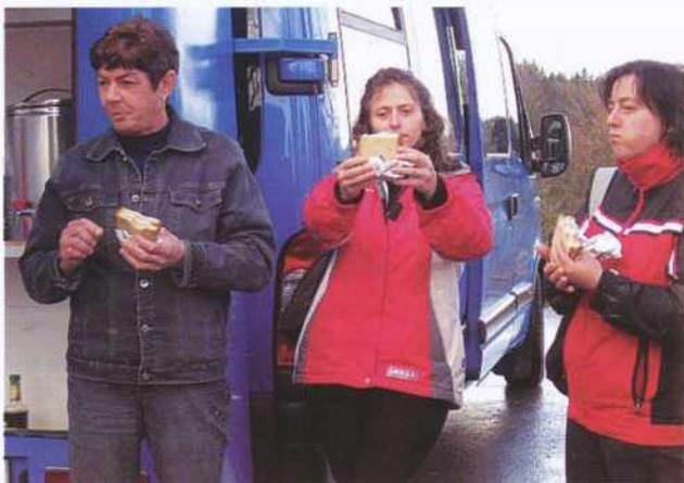
Brez dobrega sendviča na izletu ne gre!