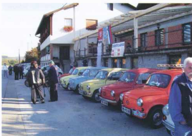
Srečanje fičkov 2008