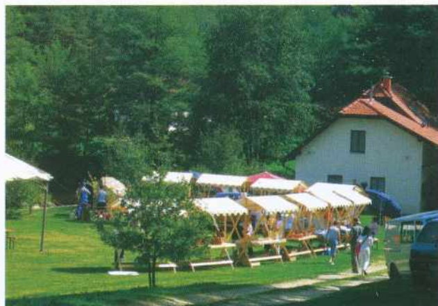
Rokodelski sejem v Neradnovcih

Zahvaljujemo se občini Gornji Petrovci in JZ KPG za pomoč pri organizaciji prireditve ter vsem, ki so finančno podprli prireditev.