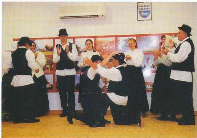
Nastop na svečani seji Občinskega sveta Občine Gornji Petrovci

Folklorno skupino KUD Goričko dobro poznajo vsi v naši občini in na širšem Goričkem, saj že vrsto let plešejo izvirne svatovske goričke plese ter s tem ohranjajo tradicijo in običaje tega dela Goričkega in tako skrbijo, da ti ne zatonejo v pozabo. V zadnjih dveh letih smo bili zaradi različnih zdravstvenih težav manj aktivni, zato pa smo se toliko bolj posvečali pridobivanju novih noš za