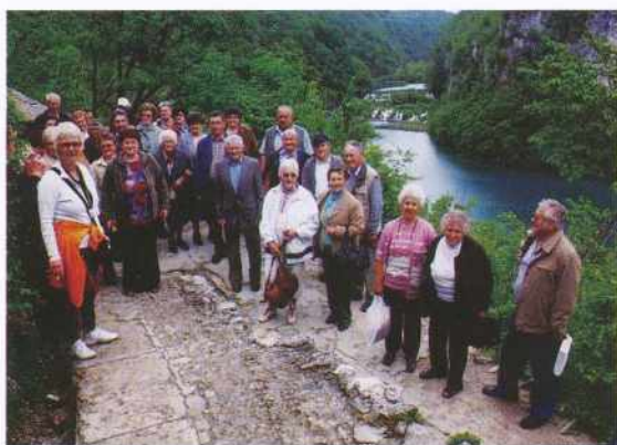
Izlet na Plitvička jezera, 23.05.2008

udeležujejo raznih srečanj, proslav, izletov, pohodov in raznih programov v okviru občine.