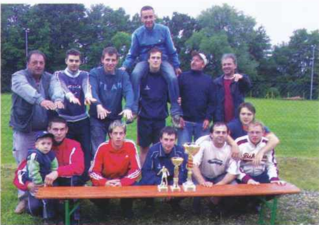
Po osvojitvi drugega mesta v Križevcih

ca, ki sedaj skrbi za tekoče zadeve na spletni strani. Naš spletni naslov je: www.kmnneradnovci.com Po kratkem predahu se je začela nova tekmovalna sezona v ligi Goričko, kamor smo se podali s podobnimi cilji, kot v spomladanskem delu. Zavedamo se, da bo pot do podobnih rezultatov zelo težka, vendar zaupamo v kvaliteto, ki jo imamo in upravičeno ciljamo na podobne dosežke. Po jesenskem delu nam kaže dokaj dobro, saj smo na drugem mestu, z mi-