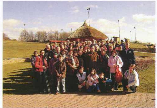
Pohodniki pri Kulturnem domu Občine Gornji Petrovci v Stanjevcih, 08.02.2008

08. februarja , za kulturni praznik, smo ponovno pripravili tradicionalni pohod za Prešernov dan. Kar ne moremo verjeti, da nam je bilo letos na