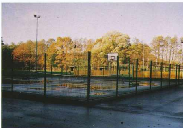
Na novo urejeno večnamensko igrišče za košarko, odbojko, tenis in v ozadju igrišče z umetno travo.

Športno društvo Nogometni klub Križevci v Prekmurju je praznoval letos 45. letnico svojega delo-