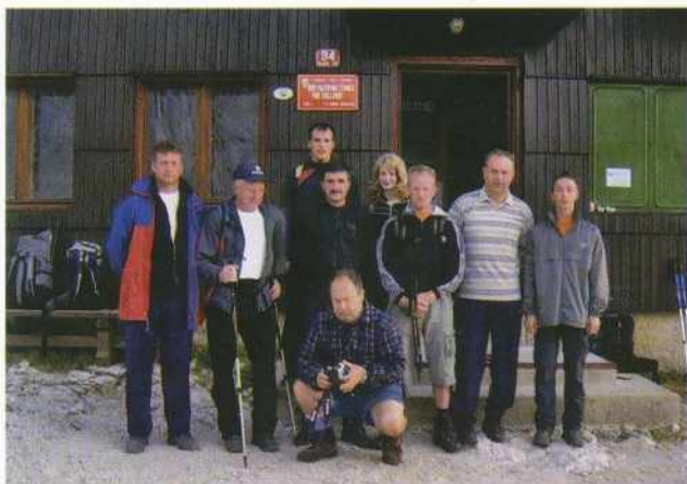
Stanjevski planinci na poti na Triglav

pa sledimo varovalnim napravam, ki nas povedejo v dolino pod Kredarico. Malo navkreber in že smo na Kredarici. Tu smo se odpočili, najedli in čez čas smo se poslovili od najlepše planinske postojanke v tem delu gorskega sveta. Krenili smo mimo kapelice in se povzpeli na sleme Rži. Po dobri uri hoje smo prišli na težko pričakovani Staničev dom. Mračilo se je že, ko smo se končno namestili v koči. Prijazne oskrbnice so nas postregle z okusno večerjo, najedli smo se, malo pokramljali in se odpravili k težko zasluženemu počitku. Naslednji dan smo popili čaj, se poslikali in krenili na pot v dolino. Podali smo se čez Dovška vrata nad Staničevem domu in se preko Konjskega sedla spustili proti Vodnikovemu domu. Pri Vodniku malo počitka, kajti začelo se je oblačiti, zato smo hitro ubrali naprej proti Pokljuki. Po gozdu Konjsčice je že precej deževalo in nas pralo proti Rudnemu polju. Bila je nevihta in tudi treskalo je vmes. No, končno smo, vsi premočeni, prišli do Rudnega polja, od koder smo se s prevozom odpeljali proti Kranju, kjer smo se okrepcali in nato krenili proti domu. Bili smo utrujeni, a vsak po svoje zadovoljen ob uspehu in neuspehu tega vzpona nad to prečudovito goro.