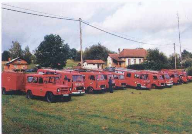
Smotra gasilskih vozil

In kot se za zaključek vsakega dobrega tekmovanja spodobi, je le-temu sledila prava domača gasilska veselica.