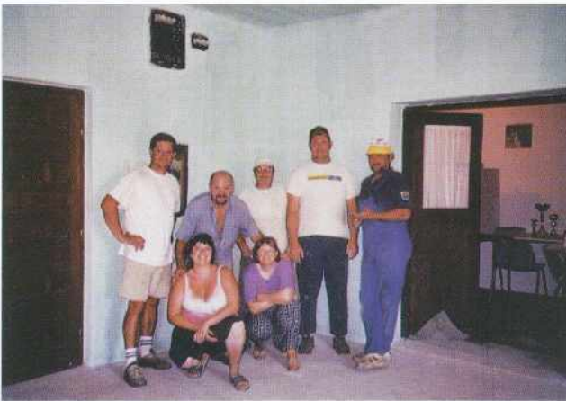
Vaščani, ki so sodelovali pri prenovi vaško - gasilskega doma