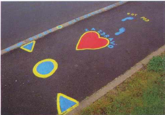
Markacija, ki je pohodnike spremljala na poti

društva. Po novoletnih praznikih bomo začeli z aktivnostmi glede zbiranja prijav za članstvo. Odločili smo se, da bomo naslednje leto v mesecu