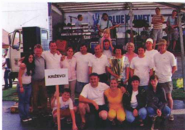
Zmagovalna ekipa vasi Križevci

popoldanskih urah pregnala nevihta, so se zvečer ponovno zbrali in ob zvokih ansambla Blue Planet praznovali še dolgo v noč.