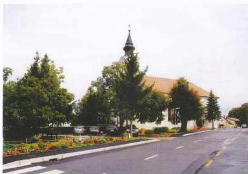
Obnovljeno vaško jedro v Križevcih