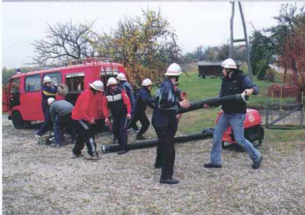
Vaja gašenja požara