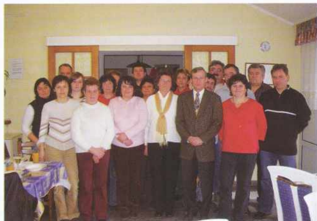
Krvodajalci KORK Gornji Petrovci, 07.02.2008