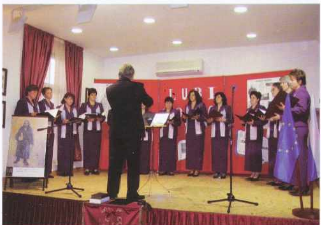
Ženski pevski zbor Primož Trubar iz Križevca