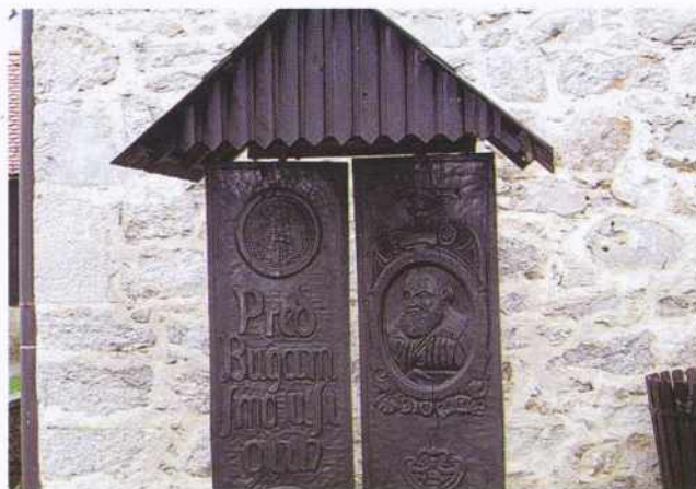
Obisk rojstne hiše Primoža Trubarja