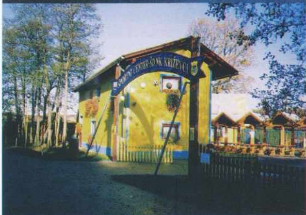
Urejeni objekti v Športnem centru Križevci