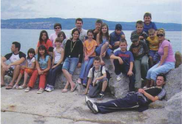
Otroci v šoli v naravi