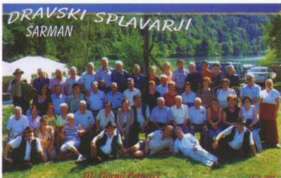
Člani DU na splavarjenju po reki Dravi, 14.08.2008

Izlet na Hrvaško z ogledom Plitvičkih jezer in Kumrovca. Naši člani so si želeli obiskati te kraje, zato smo se 23. maja 2008 v jutranjih urah odpravili proti mejnemu prehodu Gruškovje. V dopoldanskih urah smo prispeli do Plitvičkih jezer. Po kratkem postanku za okrepčitev, smo se usedli na vlakec in se odpeljali do jezer. V dveh urah smo si