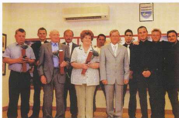
Nagrajenci občinskih priznanj