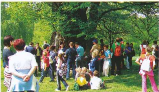
Pohodniki na počitku pri kostanju na Tetajnem bregu