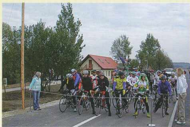
Start 3. trideželnega kolesarskega maratona

S predznakom Oaza zdravja se namenu krepitev telesa z rekreacijo, kulinariko in estetskim