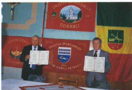
Podpis listine o pobratenuju z DU Odranci, 24.03.2008