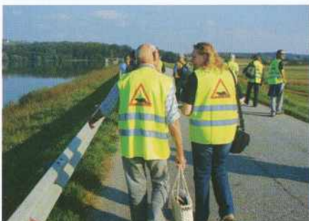
Varnostni brezrokavniki z vidro v prometnem znaku so upočasnili marsikatero vozilo - če ne drugega, iz radovednosti voznika.