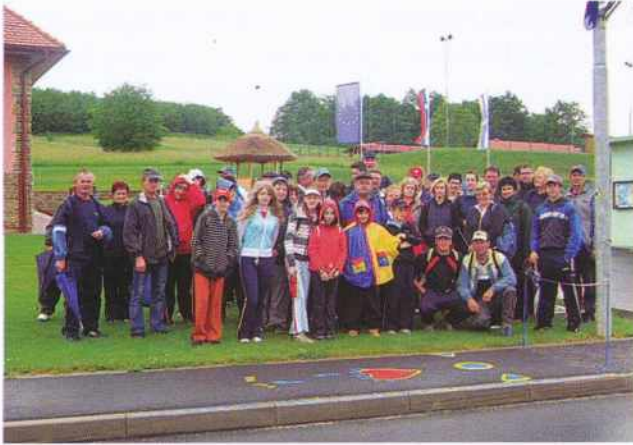
Pohodniki na startu

društva. Po novoletnih praznikih bomo začeli z aktivnostmi glede zbiranja prijav za članstvo. Odločili smo se, da bomo naslednje leto v mesecu