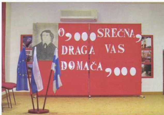
Oder so uredili učenci OŠ Gornji Petrovci