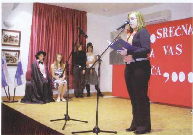
Učenke OŠ Gornji Petrovci