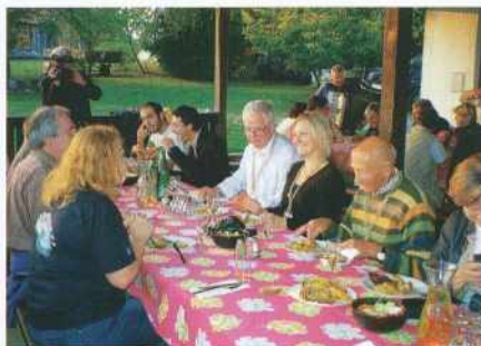
V sproščenem pogovoru v idiličnem goričkem okolju, ob odlični hrani in pijači, ob glasbi in petju, se je zaključilo srečanje evropskih strokovnjakov za vidro.