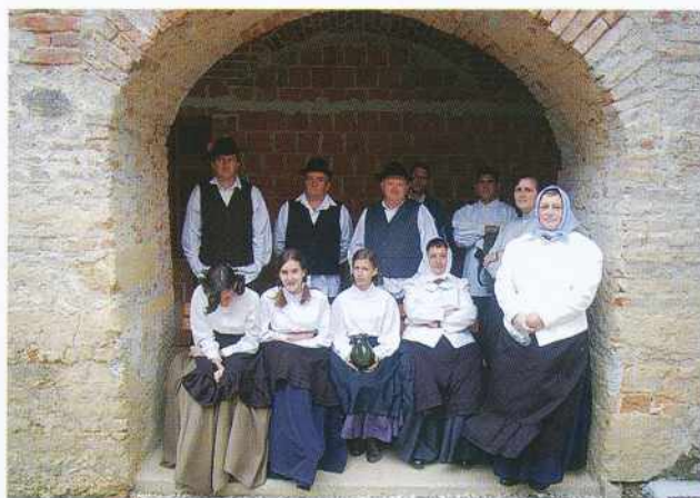
Nastop na gradu Grad

Na tem mestu bi se radi iskreno zahvalili sponzorjem, ki so nam omogočili nakup novih noš: Pomgrad, Veterinaria Murska Sobota, Kema Pucenci, Kalamar Goričanka, Dill d.o.o., Adriatik - Slovenika, BTC- Murska Sobota in Občina Gornji Petrovci.