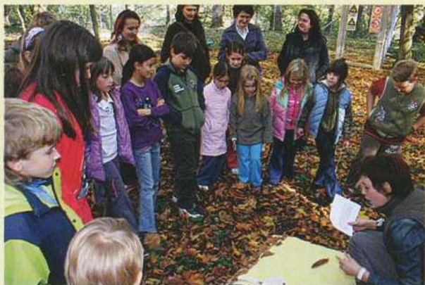
Doživljajska delavnica Veliki nemarni škornji

Posebej smo bili veseli obiskovalcev iz novo nastajajočega parka Radensko polje in obiskovalcev iz Loškega potoka, saj so med njimi bili tudi naši sodelavci in sodelavke.