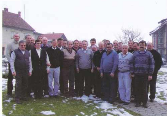
Krvodajalci KORK Ženavje, 10.01.2008

Kot že vrsto let so bili tudi letos krvodajalci v naši občini zelo dejavni. Udeležili so se številnih krvo-