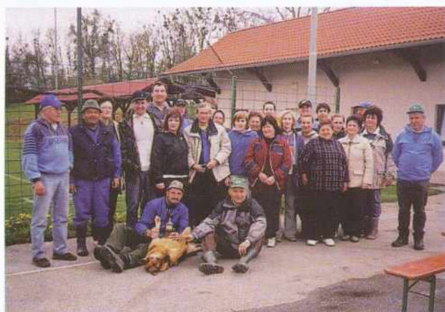
Čistilna akcija v Stanjevcih

okolje pa se nikoli ne udeležijo čistilnih akcij. Prav nasprotno, norčujejo se iz tistih, ki jim je stalo do urejenega okolja.