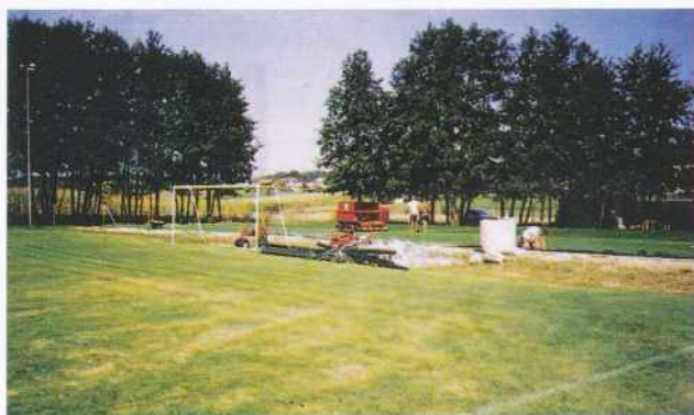
Polaganje umetne trave