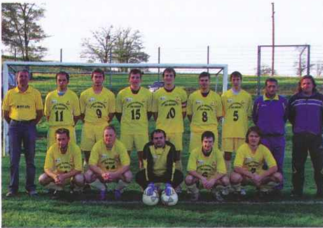
Članska ekipa ŠD Neradnovci