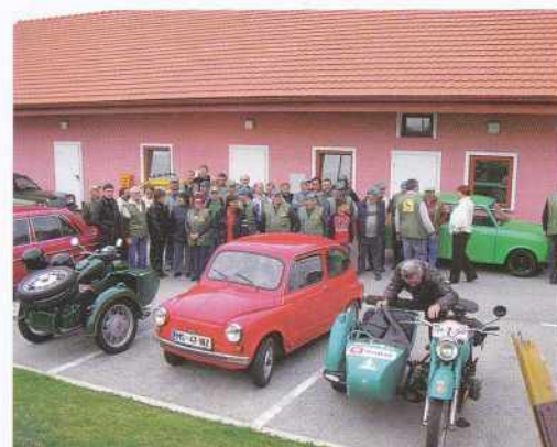
Zaključna vožnja 2008