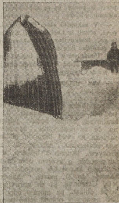
V vzhodni Prusiji je zavladal silen mraz ter veliki snežni zameti. Naša slika kaže, kako visoko je sneg zametel kmečko vas, tako da imamo videz grenlandske pokrajine.

nistra Takahašija, ki je ranjen. Čete tokijske garnizije vzpostavljajo red, do katerega bo prišlo v najkrajšem času.