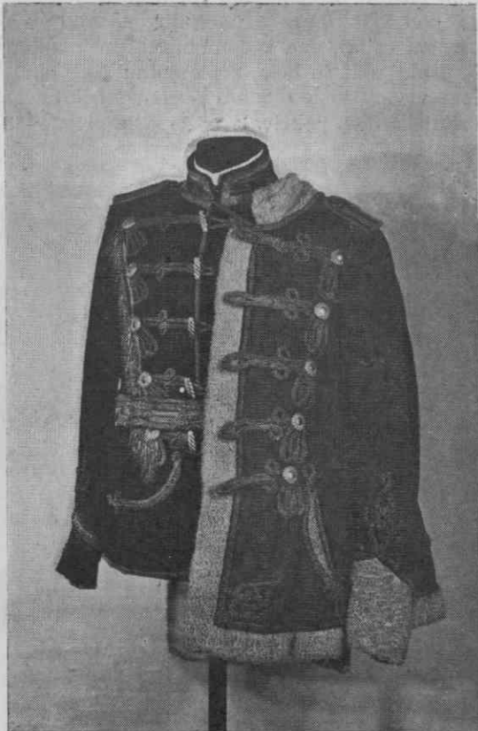
Pruska huzarska oficirska uniforma (z zimsko atilo) — Pokrajinski muzej Maribor

Prusko huzarsko opremo dopolnjuje še črna krznena kučma z rdečo, prek zgornjega roba kučme visečo vrečico. Na kučmi je pritrjena bela vrstica, ki so si jo huzarji, podobno kakor ulanci, privezovali na suknjič. Nadalje sta v kolekciji dva huzarska pletena pasova — oficirski iz srebrnih in vojaški iz belih volnenih vrvic. Slednjič velja omeniti še oficirsko