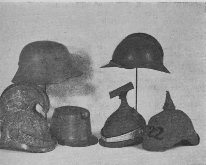
Vojaška pokrivala iz prve svetovne vojne. Spredaj: avstrijski dragonci, huzarji in ulanci, nemška pehota. Zadaj: nemško-avstrijski in francoski šlem

oficirski čapki, zapaščina iz polkov št. 6 (temno rdeča) in št. 12 (svetlo modra).