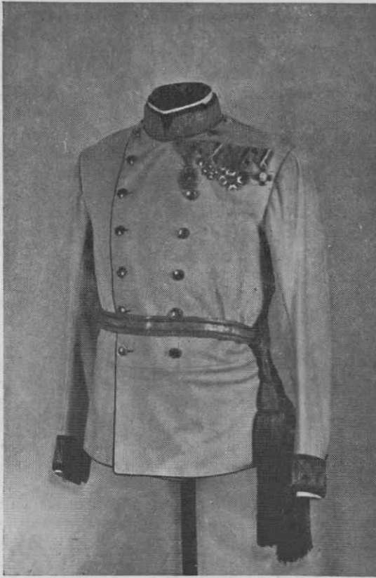
Suknjič avstrijske generalske gala uniforme iz konca XIX. stol. — Pokrajinski muzej Maribor

zbirke. Tako imenovano generalsko gala uniformo — bel suknjič in živo rdeče, z zlatom obrobljene hlače — zasledimo v predpisih o nošenju uniform še leta 1911. Vendar so bili ti svečani kroji takrat praktično že iz rabe, saj je generaliteta na splošno nosila tudi za svečane priložnosti službeni modro sivi »Waffenrock« z zlatimi našitki na svetlo rdeči podlagi. V naši kolekciji najdemo en suknjič te vrste (s činom feldmaršallajtnanta). Prav tas perjanicami iz čapljinega perja in dve zlato so v zbirki trije generalski dvorogeljniki generalski ešarpi.