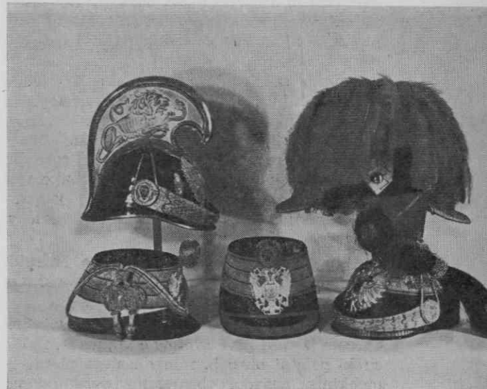
Avstrijska oficirska pokrivala. Spredaj: huzarska in pehotna čaka, ulanska čapka. Zadaj: dragonski šlem in generalski klobuk — Pokrajinski muzej Maribor

Od opreme ulancev hrani mariborski muzej svetlo moder oficirski povrhnji suknjič-ulanoko. Suknjič ima krznen ovratnik, rdeče našitke na rokavih in značilne ulanske rese med gumbi na hrbtni strani. V zbirki sta tudi dve