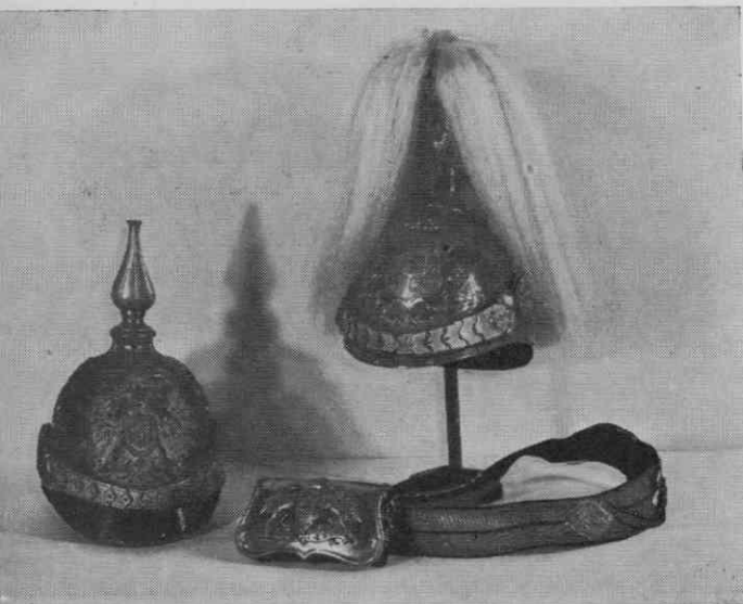
Oprema avstroogrskih gardnih enot: šlem pehote in šlem ter bandelier s kartužo »Arcierov« — Pokrajinski muzej Maribor

Približno iz istega časa kakor bela suknja in čaka izvira tudi klobuk avstrijskih lovcev. Po tipu je dvorogelnik s petelinjo perjanico na vrhu in z značko — lovskim rogom, ob strani. V zavoju roga je bataljonska številka 19. Klobuki lovskih enot so v XIX. stoletju nekajkrat spremenili obliko, perjanice so uvedli leta 1840, dvorogelnike pa so pozneje