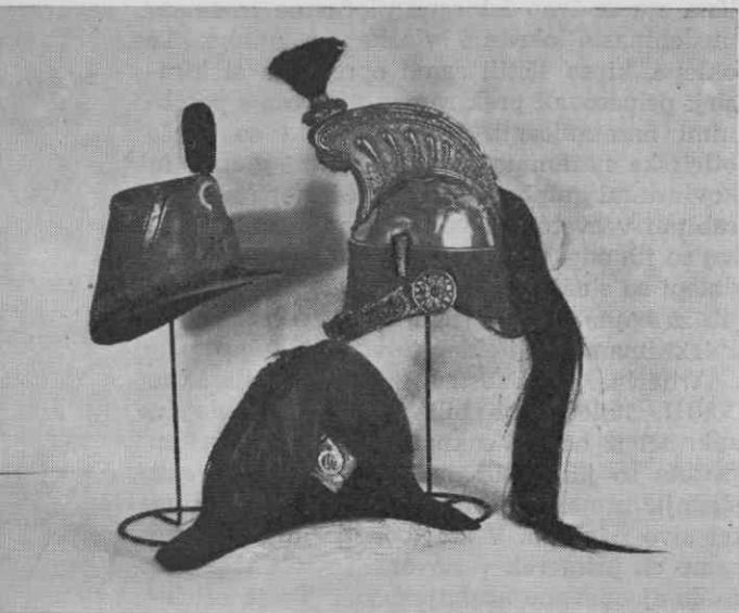
Francoska pehotna čaka in kirasirski šlem ter avstrijski lovski klobuk iz druge polovice XIX. stol. — Pokrajinski muzej Maribor

valo postajalo vse nižje in se je ob koncu XIX. stoletja močno približalo sočasnim francoskim čakam.