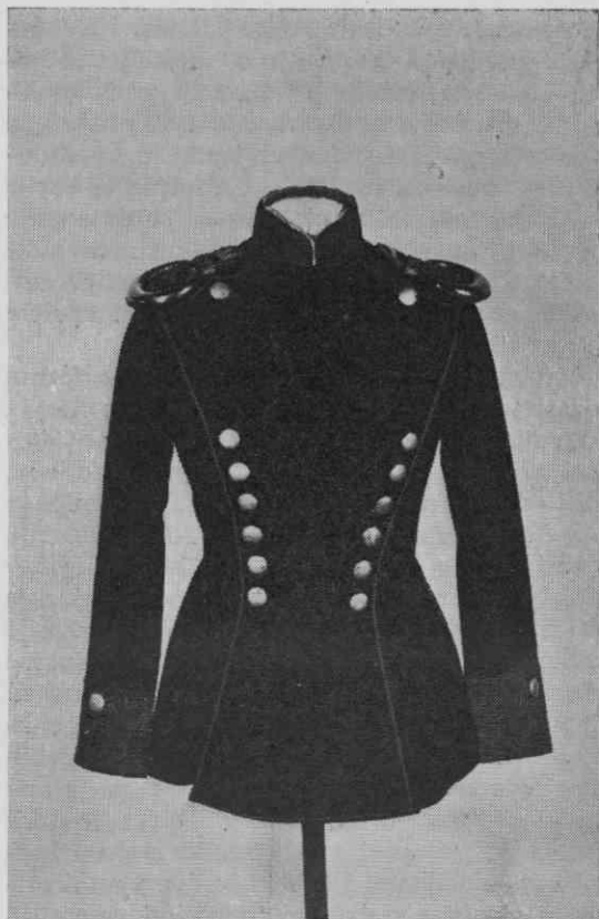
Suknjič-ulanka pruskega ulanskega polka št. 6 — Pokrajinski muzej Maribor

poleonske dobe. Za to govori poleg valjaste, proti vrhu razširjene oblike predvsem debelo usnje, iz katerega je čaka narejena. Tudi okrasna vrvica se zdi originalna in je videti, da je bila nekoč bele in modre barve, kar bi govorilo za bavarsko poreklo pokrivala.