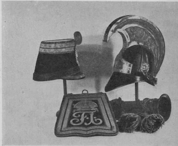
Kirasirski šlem in huzarska torbica iz časa Franca I. ter pehotna čaka iz 60. let XIX. stol. — Pokrajinski muzej Maribor

K opisani beli uniformi so sodile svetlo modre dolge hlače, ki se žal niso ohranile, pač pa je iz istega časa oficirska paradna čaka. Oblika čak se je pogosto menjavala: od visoke z usločenim valjem pa vzorcu modnega cilindra v času bidermajerja se je prek nekaterih različic v petdesetih in šestdesetih letih XIX. stoletja razvila okoli 25–30 cm visoka čaka z zadaj nekoliko poševno oblikovanim valjem. Tako obliko ima tudi mariborska čaka. V nadaljnjem razvoju je to pokri-