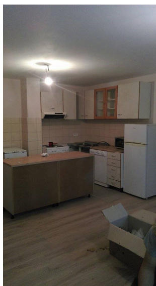
Kuhinja po prenovi.