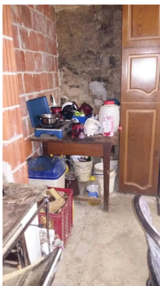
Kuhinja pred prenovo.

Člani Dobrodelnega društva Pomagajmo odprtih src so v letu 2017 izvedli večjo akcijo, ureditev bivalnih razmer družini na Goričkem, v kateri živi sedaj že 18-mesečna deklica. K akciji so pristopili konec meseca februarja, družina pa se je konec maja že vselila v novo urejeno hišo. V hiši niso imeli vode, elektrike in kopalnice. S pomočjo podjetij in obrtnikov ter prizadevnosti članov društva jim je uspelo v zelo kratkem času urediti hišo v dostojno bivanja. Žalostno je, da še vedno veliko družin v Pomurju živi brez vode, elektrike in kopalnice. Največkrat gre za družine, v katerih živijo šoloobvezni otroci, ki nimajo možnosti, da se dostojno uredijo za šolo.