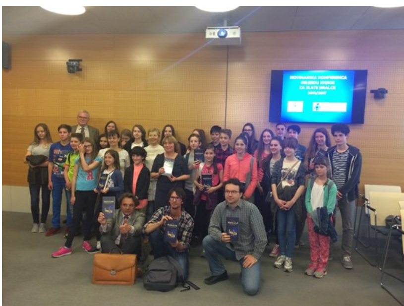
Učenci OŠ Poljane Ljubljana in OŠ Martina Krpana Ljubljana