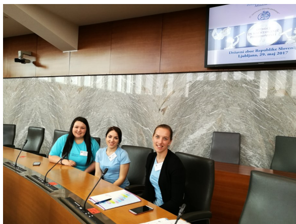
Pomoč študentk je bila dobrodošla tudi pri organizaciji 27. nacionalnega otroškega parlamenta.