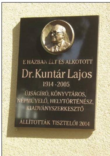
Spominska plošča v Szombathelyu

bil zaradi tega zapostavljen. Kjer koli je bil v službi, je vedno našel temo, o kateri bi pisal. Zelo rad je pisal in je objavil veliko člankov, razprav in tudi nekaj knjig. Že leta 1938 je napisal monografijo rojstne vasi Csörötnek, ki jo je dopolnjeno izdal leta 1990 pod naslovom Trojna knjiga o Csörötneku (Hármaskönyv Csörötnekről) .