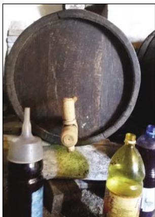
Tihožitje v kleti

Vinska trta je ena najstarejših kulturnih rastlin, ki so jo poznali že stari Rimljani. Veliko slovenskih in porabskih