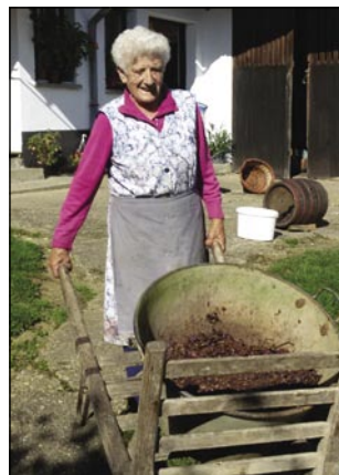
Tropine so se odpeljale na njivo