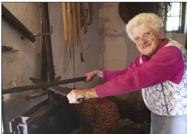
Ili s staro prešo

vostno vino, pa vendar med mnogimi priljubljeno. Naša trta je stara že preko 100 let, a še vedno žlahtna v svojem bistvu.