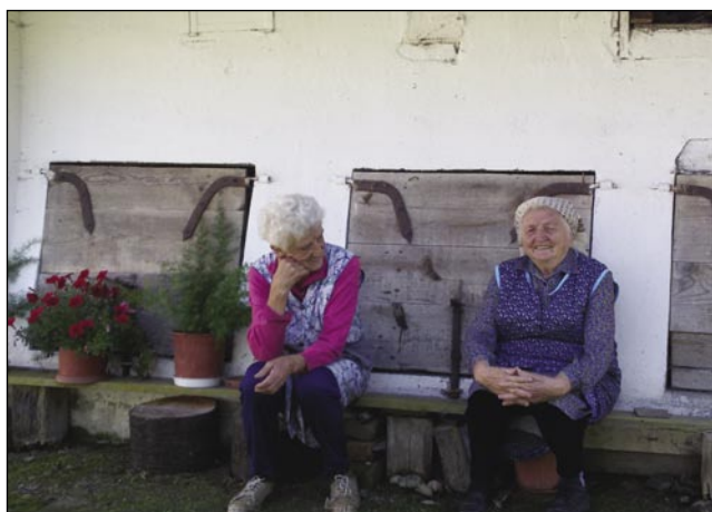
Sosedi med klepetom

Še deset dni po prešanju grozdja imam lep spomin odtisnjen na kožo dlani. Barva grozdja se namreč zažre globoko v pore. Pa nič ne de, saj me navdaja hvaležnost, da mi je v mladih letih dano prešati po stari navadi. Mlade generacije danes namreč ne vedo več, od kod prihajajo živila. Seveda iz trgovine! Na hribčku pa sameva trsek, ne eden, ampak veliko jih je, ki čakajo, da bi bili obrezani in