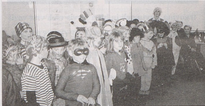
Program so nam popestrili otroci nižje stopnje OŠ Šmartno.