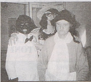
Naši oskrbovanci v pustnih maskah

Poleg vsega pa so bili prav zanimivi tudi učenci nižje stopnje OŠ Šmartno, ki so nas obiskali v zelo velikem številu. Predstavili so se z bogatim kulturnim programom. Seveda tudi harmonikarja ni manjkalo. Njegove vesele viže so še dvignile razpoloženje