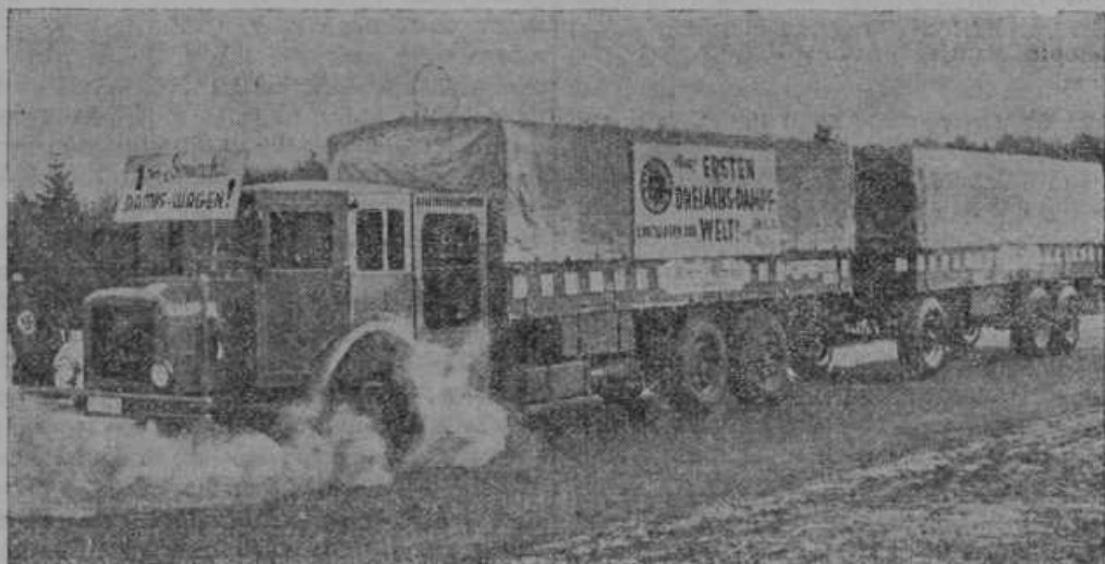
Avtomobil na paro so spravili v promet v Kasselu na Nemškem.