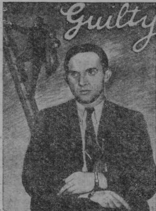
Ugrabitelj Lindberghovega otroka Nemeec Hauptmann obsojen na smrt. Slika nosi zgoraj napis »Kriv«. Vidimo tudi, kako odnaša Hauptmann Lindberghovega otroka.