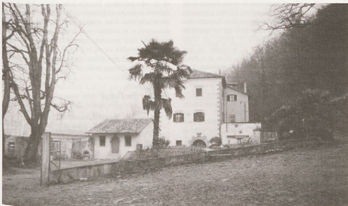
Pogled na domačijo Pikel - stanovanjski objekt, mlin in žago

Pekel, kakšno čudno in posrečeno ime! Nekoč bogatija, danes v kolesju pozabe, odrinjen od vsakdanjega življenja. V isti pozabi kot mlinska kolesa, ki se ne vrtijo več. Edino, kar prinaša dih sodobnosti, je še vedno nova voda in predvsem nedeljski obiskovalci, ki zmotijo spokojni mir. Toda Peksu se obetajo boljši časi! V zadnjih letih poteka celovita obnova tega kulturnega spomenika 1 .