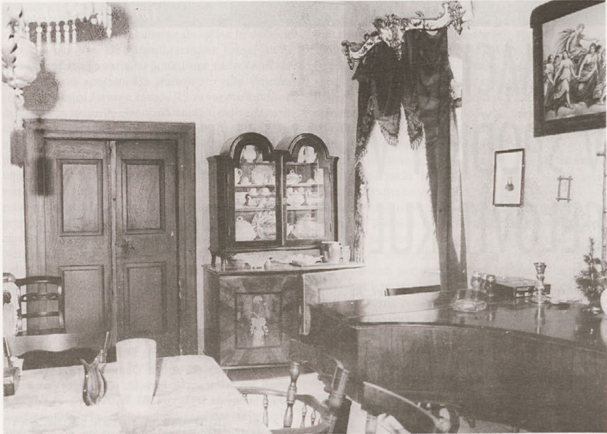
Salla: oprema v njej