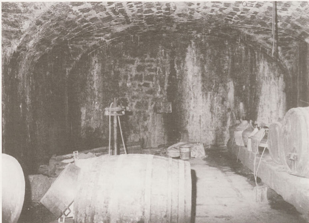
Notranjost vinske kleti

Najbolj običajen način plačevanja mlevskih uslug je bil z »odmero merice«. Le redki so plačevali z denarjem. Velikokrat se je tudi zgodilo, da so stranke ostale dolžne plačila. V družinskem arhivu hranijo več listin oziroma tožb o neplačanih terjatvah. Za plačilo je mlinar nudil strankam tudi druge usluge, npr. pekli so tako imenovan mlačev kruh (iz ječmena), nudili štalo za počitek, česar pa vsi niso zmogli.