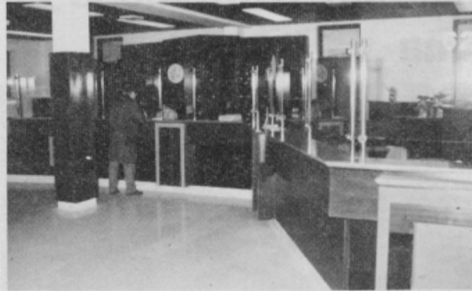
Notranjost nove ormoške pošte.

Nekaj opreme, da bo pritličje urejeno, bodo še dokupili, drugo bodo naredili domači poštni mizarji v Mariboru. Urediti morajo še sobo za šoferja poštnega avtomobila, ki vozi zjutraj na relaciji Maribor—Ptuj—Ormož—Središče ob Dravi, popoldan pa se vrača proti Mariboru.