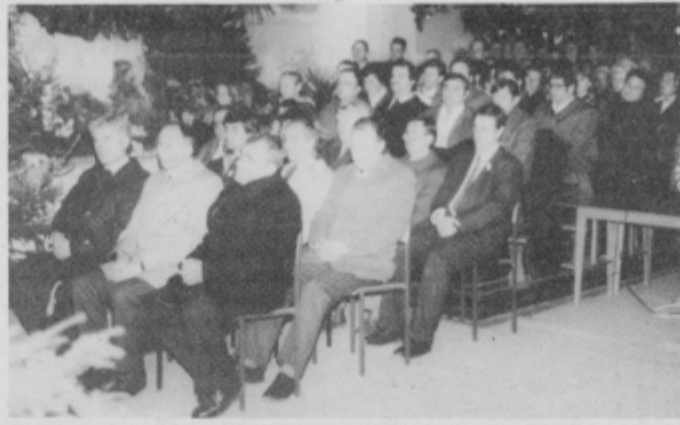
Slovesna božična maša v cerkvi sv. trojice v Gradišču.

Najprej so se vsi omenjeni gosti srečali na razgovoru s predstavnikoma lenarške skupščine, izvršnega sveta in nekaterimi predstavniki gospodarstva. Namen srečanja je bil predvsem razgovor o hitrejšem razvoju občine Lenart in o vlogi cerkve na Slovenskem. Na številna vprašanja (kdaj bo sprejet zakon o denacionalizaciji, kdaj o zadrukah, ali bo do spomladi že mogoče vedeti, katero zemljo bo kdo obdelo-