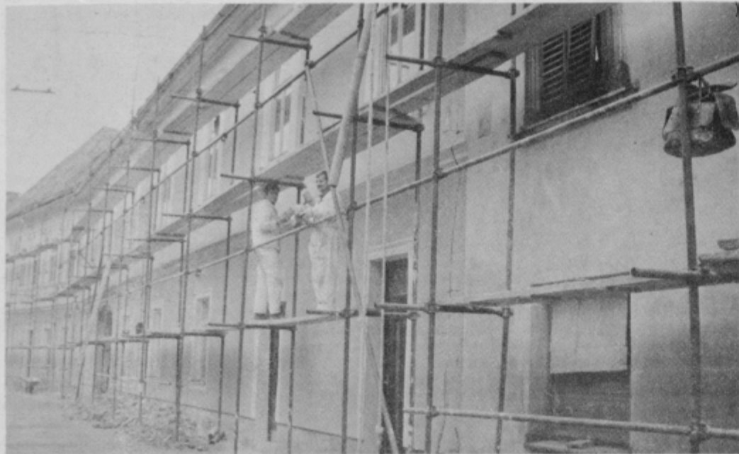
Obnovitvena dela zunanosti Narodnega doma v Ptuj potekajo v težkih vremenskih razmerah, saj je zima.

Konec lanskega leta so delavci Zavoda za spomeniško varstvo iz Maribora pričeli obnovitveno delo na zunanosti Narodnega doma v Ptuj. Do sedaj so fasado že v celoti obnovili, kljub slabemu vremenu pa jim je uspelo celotno poslopje od zunaj tudi prebarvati. Delo nadaljujejo v Vošnjakovici ulici, v nadaljevanju Narodnega doma.