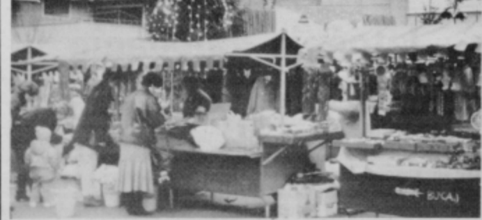
Takšna je bila novoletna podoba ptujske tržnice.

V sekretariatih ocenjujejo, da je novoletni sejem ne glede na pomanjkljivost dosegel namen. V poslovnem pogledu bi lahko ponudil še več, pripomb na prireditveni del pa ni bilo, razen da smo jih premalo popularizirali. Novoletno srečanje občanov kaže v bodoče organizirati kot prireditve. —MG