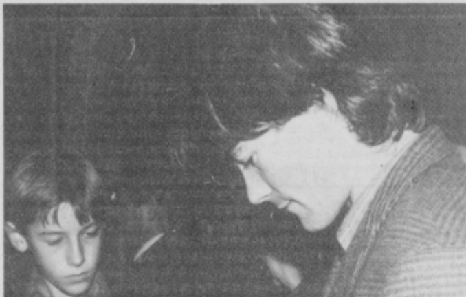
Za avtograme so morali čakati v vrsti. (McZ.)

»V hribe sem pričel hoditi kot otrok, v osnovni šoli. Pod njimi