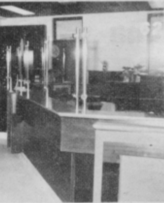
Notranjost nove ormoške pošte.

Vzporedno z novo ormoško vozliščno telefonsko centralo bo do dali v promet novo digitalno centralo v Miklavžu pri Ormožu, ki služi za potrebe Miklavža in