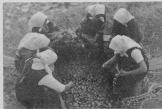
Lukarice pletajo vence. (Fotografija iz l. 1935. Foto: F. Piuk — za ilustracijo naslovnice prve izdaje Lukarjev A. Ingoliča.)

vitri. Tanjšo vitro so položile na dvojce prek sredine debele vitre (glej skico). Tako so dobile tri vitre, s katerimi so pričele pletiti kito. V desno vitro so na enake razdalje vpletale lukova stebelca. V eno kito so vpletle 12 enako debelih lukovih glav, le prva je bila ponavadi debelejša. Če je med pletenjem kite zmanjkalo slame — kaj takega se ni smelo zgoditi — so jo dodale. Na koncu so na-