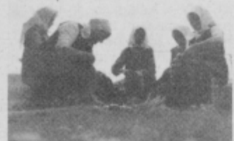
Pletenje venca.

Pripravile so šope ržene slame — »podrajčjake«, ki so jih uporabljali tudi za prekrivanje streh. Iz šopa so potegnile manjši šop slame, jo namočile v topli vodi, jo natokle s kiji — »butačami« in pohodile. Takšen šop slame so razdelile na dve neenako debeli