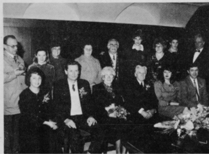
Zlatoporočenca v poročni dvorani na magistratu v Ptuj