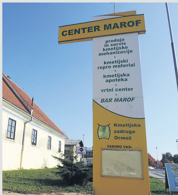
Deželna banka Slovenije je za okoli dva milijona evrov med drugimi kupila Marof z vsemi trgovinami in s celotno upravo.

V okviru stečajnega postopka ormoške zadruga je prodaja