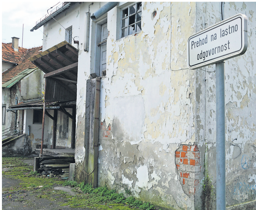
Z ruševinami nekdanjega gospodarskega objekta pri mlinu se ukvarja medobčinska komunalna inšpekcija.

Iz medobčinske komunalne inšpekcije SOU Sp. Podravje sporočajo, da za parcelno številko, na kateri so ruševine odstranjenega objekta, vodijo inšpekcijski postopek. Sprožili so ga na podlagi določb Odloka o javnem redu in miru v MO Ptuj: »Ta v 8. členu določa, da je zaradi varstva okolja in zunanje podobe kraja prepovedano opustiti vzdrževanje, čiščenje in urejanje zgradb, dvorišč, vrtov, nasadov, poti, ograj in drugih objektov, ki v neurejenem stanju kazijo zunanji videz oko-