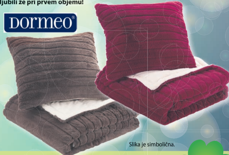
Slika je simbolična.

Nov set odeje in vzglavnika Dormeo Warm Hug bo hitro postal vaš najljubši spremljevalec v hladnejših dneh, saj ponuja prav vse: prijetno toploto ter razkošen in izjemno udoben objem. Ta prijeten in trendovski set v trenutku ustvari udoben kotiček za počitek in je na voljo v kombinaciji dveh barvnih odtenkov, ki se prilagata vsakemu prostoru. V njegovo mehko udobje se boste zaljubili že pri prvem objemu!