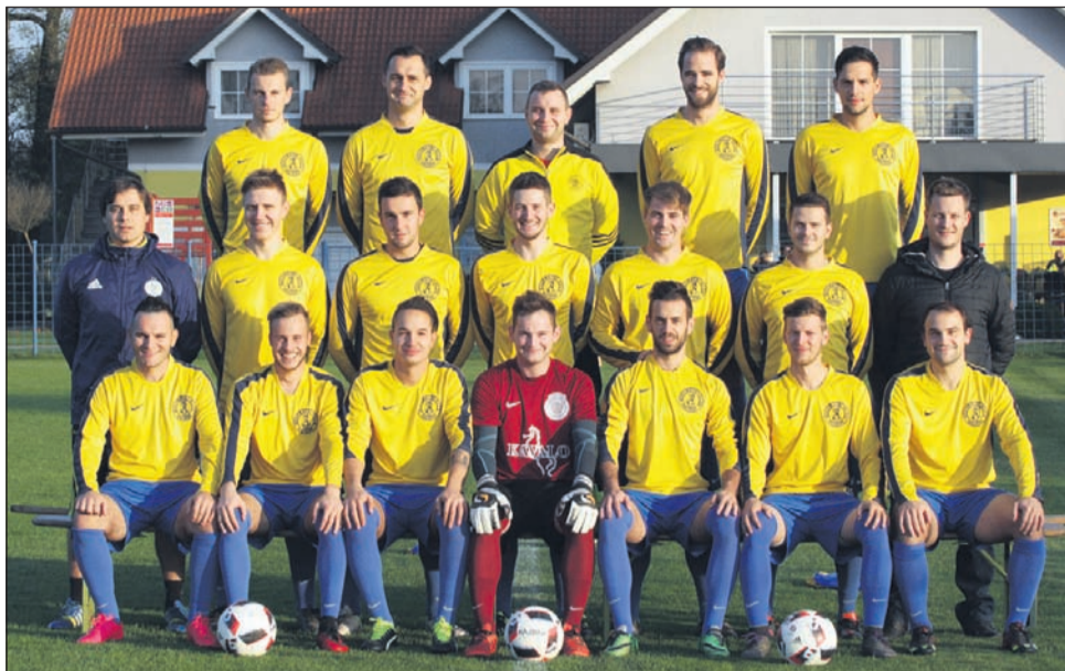
Nogometaši Hajdine (na fotografiji) so ugnali Stojncane in jih prehiteli na lestvici.

Rumeno-zeleni so srečanje odigrali zrelo in pametno; na igrišču je mlada zasedba dobro stala in domačinom povzročala kar precej težav. Gostje so pretili predvsem iz protinapadov, iz enega izmed njih je sila nevarno zapretil Plajnšek. Domačini na drugi strani so poskušali predvsem z visokimi podajami, toda pretirane nevarnosti za Malogorskega ni bilo.