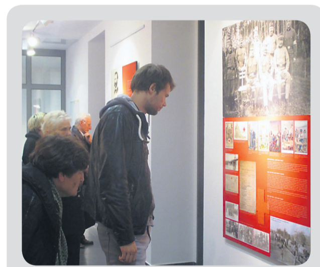
Razstavo si lahko v Zgodovinskem arhivu na Ptuj ogledate vsak delovnik med 8. in 15. uro.