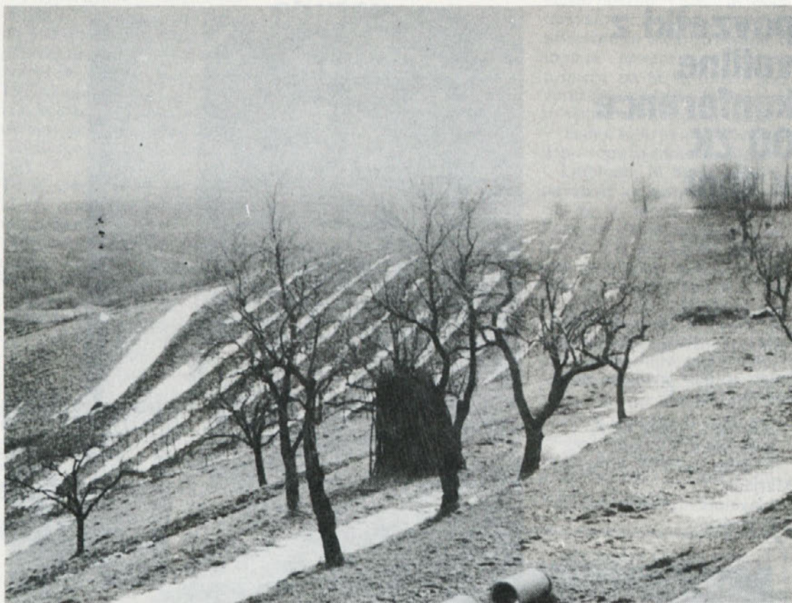
Sromlje v decembru

V oktobru smo sprejeli v Ločni na priučevanje 13 novih delavk. Pet med njimi ima ko-