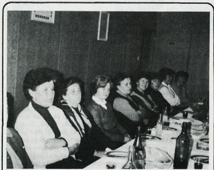
Na novoletnem srečanju upokojencev iz Libne je bilo nad vse prijetno, saj so organizatorji poskrbeli za obilo jedače, za dobro pijačo in za veliko dobre volje.

Julij: Tokrat so otroci Labodovih delavk letovali na Debelem Rtiču.