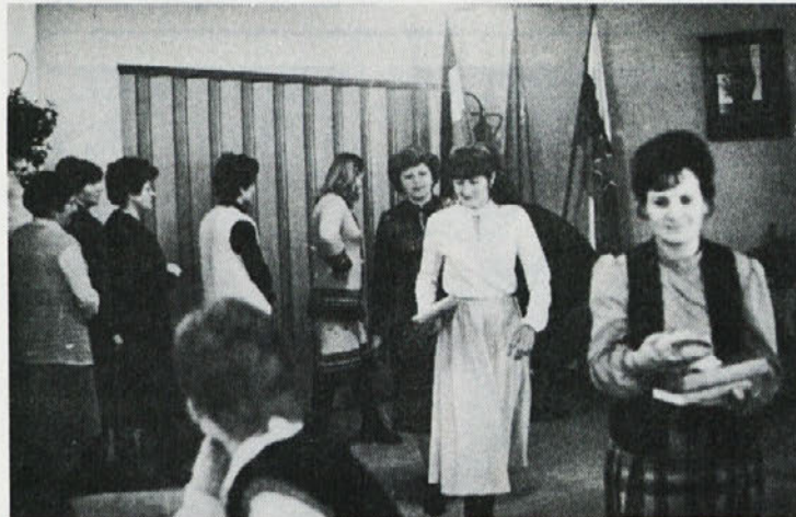
V Libni prirede vsako leto ob prazniku naše delovne organizacije tudi razstavo ročnih del delavk Libne. Posnetek kaže letošnje sodelujoče, ki so za svoja dela prejele tudi skromno priznanje.

začeli ob moških srajcah izdelovati tudi bluze. Junij je tudi čas našega kviza — letos so zmagali predstavniki DSSS, ter obeležja dneva samoupravljalcev, ko razdelimo priznanja za naše najboljše delavce — samoupravljalce. In končno so se v juniju mesecu zbrali tudi vsi Labodovi štipendisti.