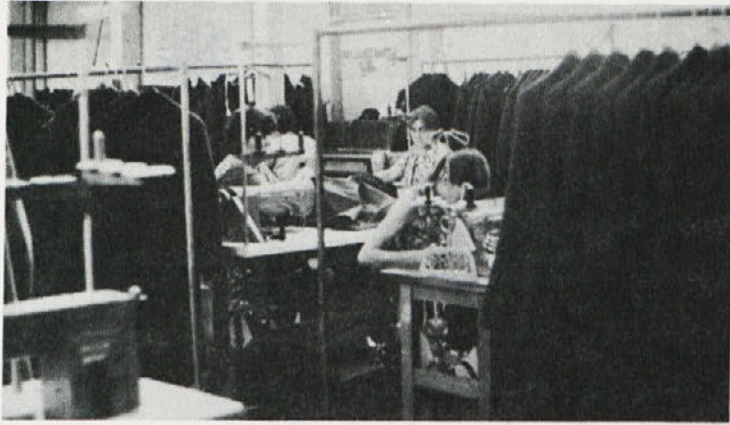
Letos so v Zali opravili nekaj vzdrževalnih del in s prostorsko ureditvijo tudi laže zadihali v proizvodnji