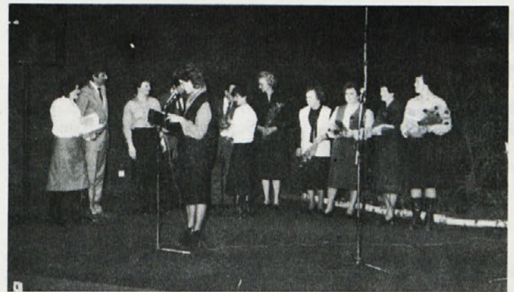
Posnetek z letošnje prireditve ob 8. marcu v Novem mestu — delavci Ločne, Commerca in DSSS, ki so se upokojili v preteklem letu.

Junij: V Temenici so začeli graditi prizidek, v Delti so