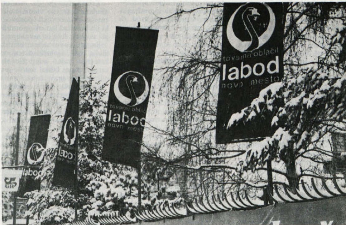
Stopamo v jubilejno Labodo leto, v katerem pričakujemo tudi večje reklamne akcije

Gradiva za posvet so bila obširna in poslana deset dni pred posvetom. V njih so posamezne delovne organizacije iz vseh republik in pokrajin prikazale stopnjo razvitosti obveščanja, položaj delavcev, ki delajo na tem področju, možnosti razvoja in ureditev tega področja v samoupravnih