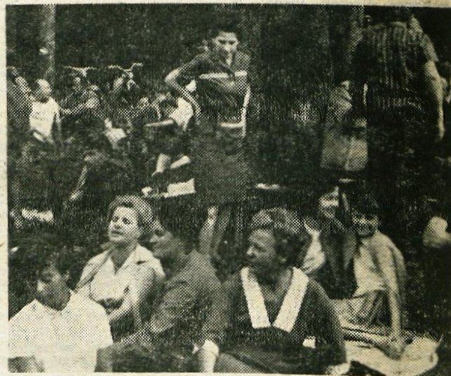
Prijetnega razpoloženja ob Rupovščici ni moglo skaliti niti slabo vreme

ognju se je srečanje nekdanjih bojnih, a sedaj delovnih tovarišev zavleklo v pozne večerne ure. Iz razpoloženja udeležencev pa se lahko sklepa, da so taka praznovanja priljubljena in jih ne bi kazalo zanemariti.