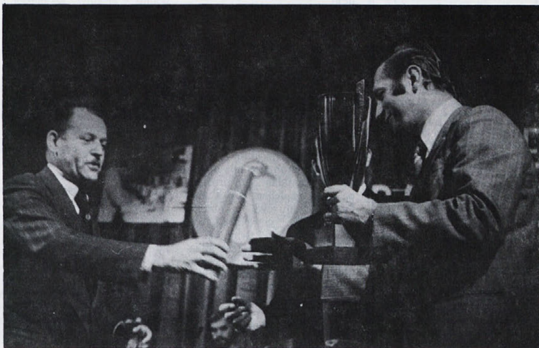
Zmagovalni tozdi Libna prejema čestitke in prehodni pokal.