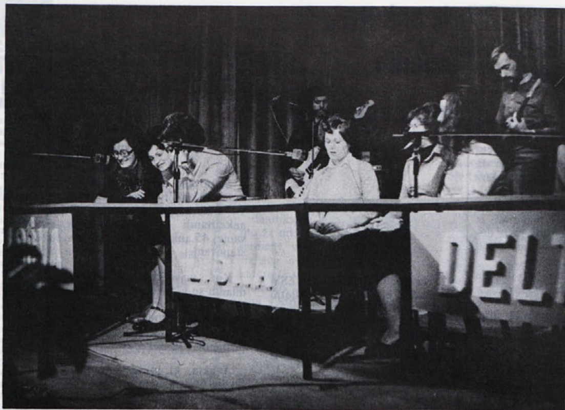
Tako je bilo prizorišče „boja“ za točke na kvizu znanja. Kljub temu da je minilo že nekaj časa od tega lepega dogodka, je še vedno živ med nami.