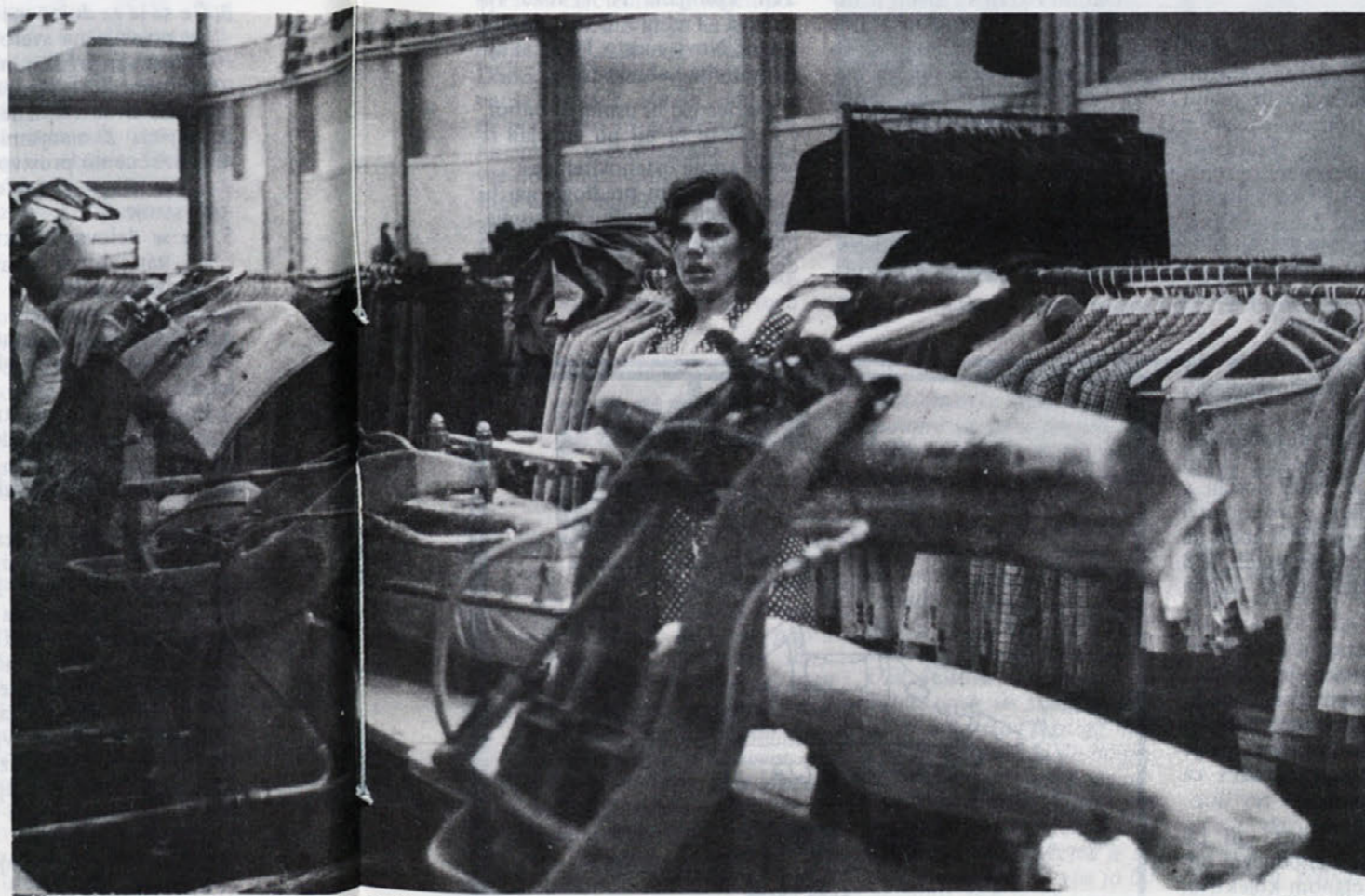
Likanje v težki konfekciji je izredno težko opravilo. Vročina je še veliko hujša kot pri srajčarjih. Posnetek je iz likalnice tozda TIP TOP v Ljubljani.