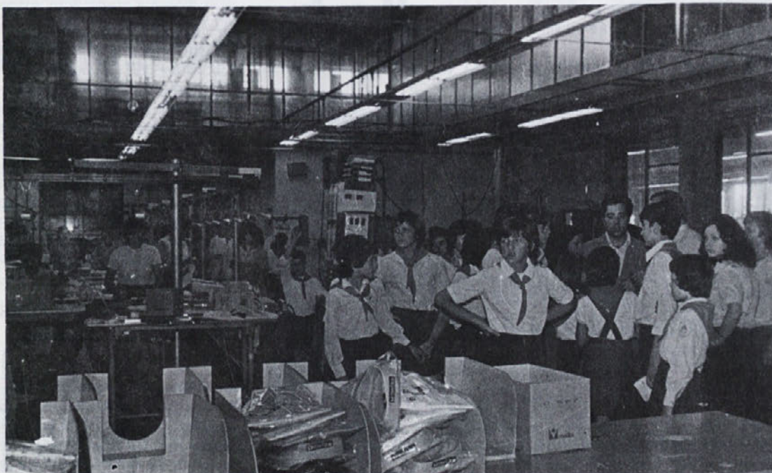
Mladim so vrata v tovarno Laboda vedno odprta. Med njimi so prav gotovo tudi naše bodoče sodelavke in sodelavci. Na sliki: obisk pionirjev v tozdu Ločna.