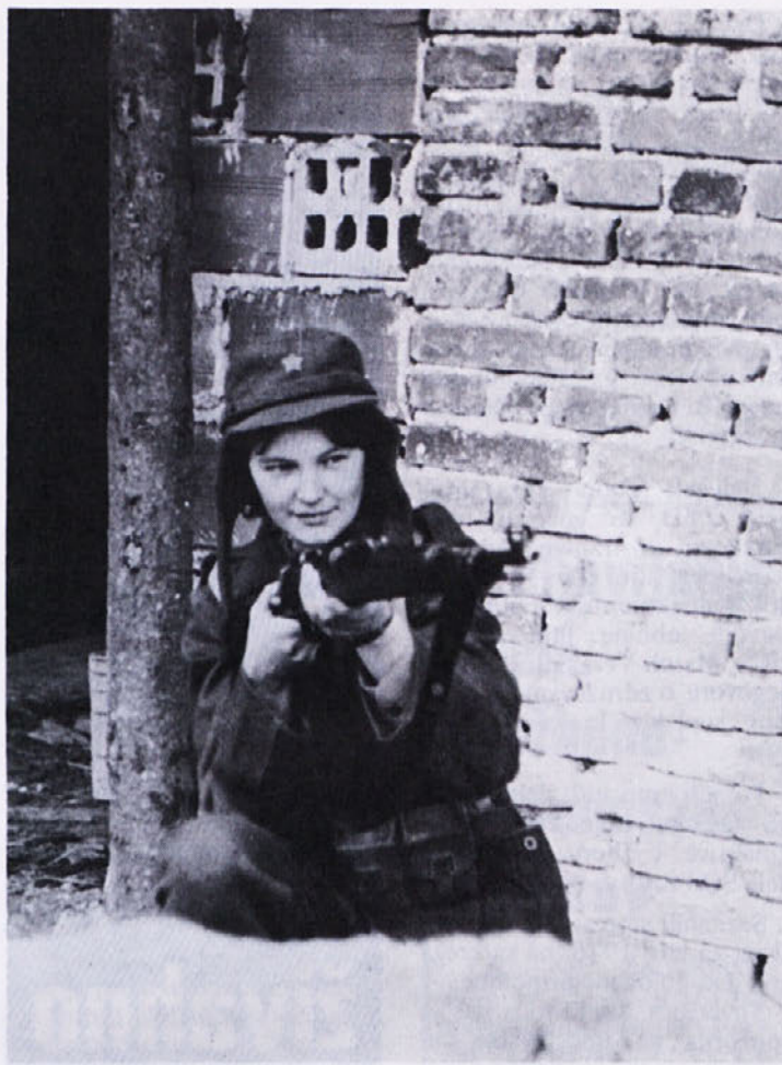
Ženska ima v naši tovarni v organizaciji SLO vidno mesto. Marsikateri orožje ni več skrivnost. Usposabljammo se, da bomo pomagali s svojimi močmi braniti našo svobodo.

Kot smo pričakovali so bile pripombe na cene naših proizvodov. Nikakor namreč ne moremo v korak s cenami nekaterih drugih firm, ki „mečejo“ na trg velike količine proizvodov po smešno nizkih, nam nedostopnih cenah. Tako je na primer poprečna cena naše bele srajce 122 din, srajce v karo desenu 160 din, naša konkurenca pa ponuja prvo za 63 din a