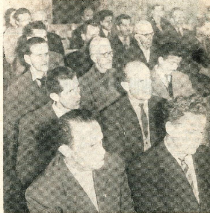
Na ponedeljkovem plenumu v Škofji Loki so razpravljali o kmetijstvu

Slabost kranjske občinske konference SZDL pa je bila v tem, da je bilo kar 13 odstotkov delegatov nepravilno odsotnih. »In kaj imate še v načrtu v zvezi s pripravami na V. kongres?«