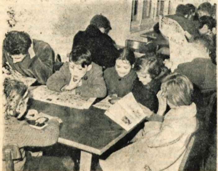
Čitalnica škofjeloške Ljudske knjižnice je vsak dan zelo obiskana. V njej se z velikim veseljem zbirajo stari in mladi. Podobne čitalnice bi morali imeti v vseh večjih krajih, saj škofjeloški primer kaže, da si ljudje podobnih ustanov želijo

D. J. Škofja Loka Vprašanje: Ali je mogoče ponovni postopek za priznanje dvojne delovne dobe. Do sedaj vam je bila leta 1958 priznana dvojna delovna doba od 28. oktobra 1936 do 28. februarja 1939