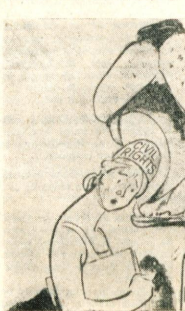
Ena mnogih karikatur, objavljenih na račun južnih »filibusterjev« v severnem tisku (The Chicago Sun-Times)

Rasna segregacija je zelo močna v južnih državah. Položaj črncev v teh državah najbolje