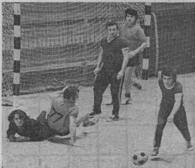
Tekmovalca v malem nogometu so ne le priljubljena, ampak tudi izredno zanimiva in borbena, kar dokazuje tudi posnetek z enega od srečanj. V jesenskem delu so imeli v TRIM ligi v malem nogometu največ uspeha predstavniki LUZ, ki so osvojili prvo mesto. M. VONČINA