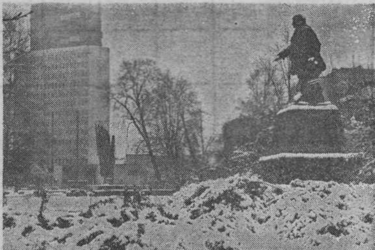
BELA OPOJNOST — Letošnji sneg je že v začetku decembra prekril ljubljanske ulice. Z njim so prišle tudi težave in veselje. Snega so bili seveda najbolj veseli otroci in ljubitelji bele opojnosti. Kot je videti, letošnja zima ne bo skopa s snežnimi padavinami.