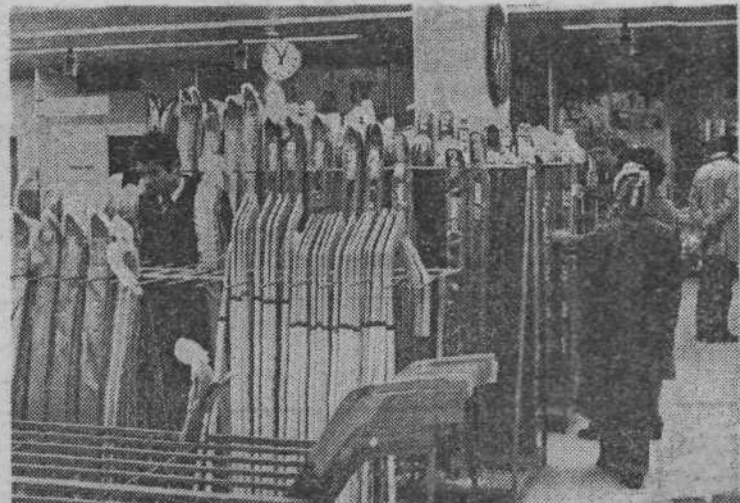
SMUCI, SANI, ... — Med sprehodom po ljubljanskih trgovinah smo opazili, da je za ljubitelje zimske rekreacije dobro priskrbljeno. Vse trgovine so dobro založene s smučmi, od najcenejših do dragih, za zahtevnejše smučanje. Za kakšno opremo se bomo odločili, pa je odvisno od tega, kako globoko bomo lahko vsegli v žep.