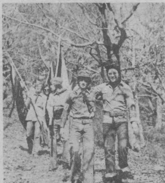
● MLADI IN REVOLUCIONARNE TRADICIJE