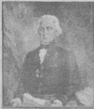
Matej Sternen, Jurij Vega, olje, 1938

Dve stoletji je prenekalera znanstvena smer v praksi potrjevala Lalandovo izjavo. Društvo matematikov, fizikov in astronomov SRS se je