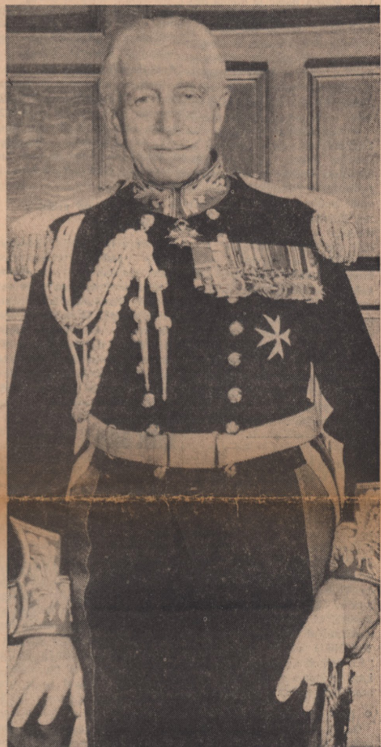
Pokojni general George Phillas Vanier, zastopnik kraljice v Kanadi.