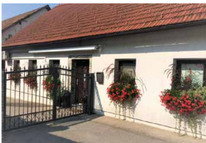
Nataša Maček, Vrhpolje 28