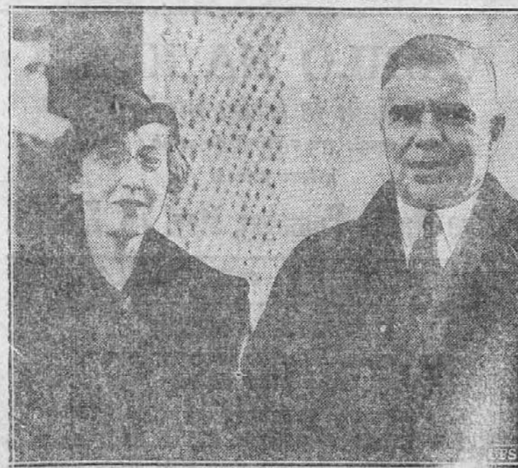
Aleks. Trojanovski, sovjetski poslanik za Zed. države, ki se je nedavno s svojo ženo povrnil v Ameriko s tri mesečnih počitnic. Pri tej priliki se je izrazil, da Rusija sicer želi mir, ve ndar pa je dobro pripravljena za vsak slučaj.