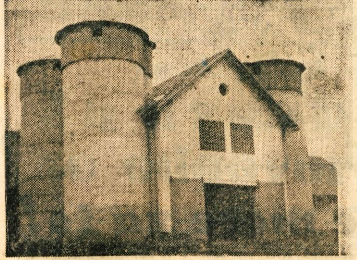
Silos Kmetijsko-gozdarskega posetva v Stari cerkvi pri Kočevju.

poučno predavanje o prometu na javnih cestah in tolmačenju cestno-prometnih predpisov.