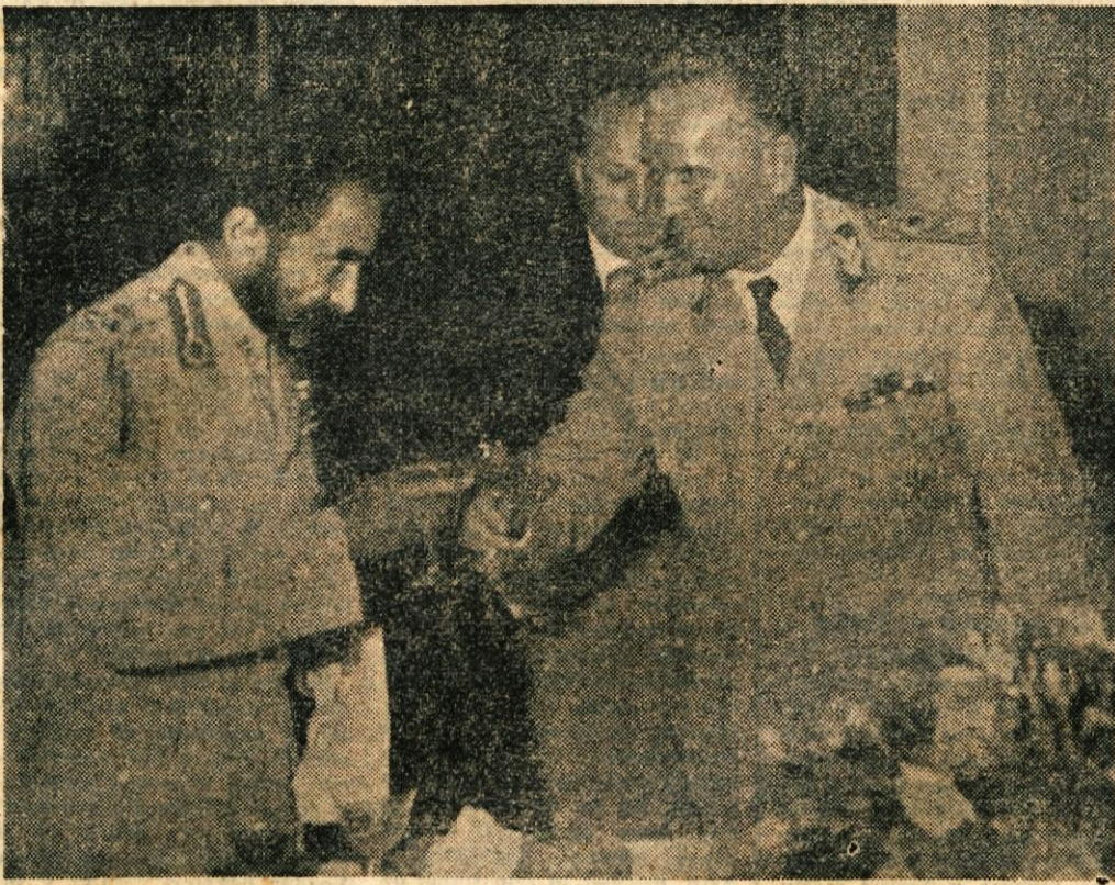
Dva velika borca proti fašizmu in zaveznika v boju za mir, enakopravnost med državami in za napredek svojih narodov sta se tu dni šela v prestolnici prijateljske Etopije. Maršala Tita je sprejel cesar Haile Selassie predvčerajšnjim v Adis Abebi z vsemi slovesnostmi in največjimi državnimi častmi.