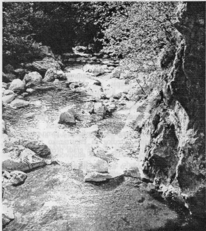
TRŽIŠKA BISTRICA POD PREDOROM V DOVŽANOVI SOTESKI