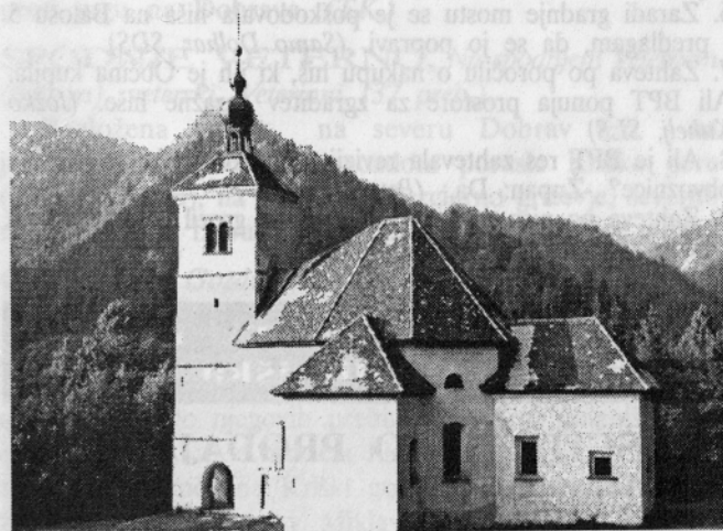
NA GRIČU SV. JOŽEFA SE PRIČENJAJO TRŽIŠKE POLETNE PRIREDITVE