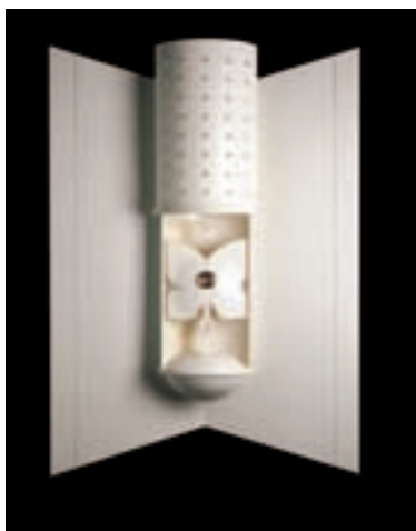
Slika 4: Relikviarj v odprti piksidi, ki ima hkrati funkcijo "svetila". The reliquary in the open piksida. The piksida simultaneously functions as a "light".