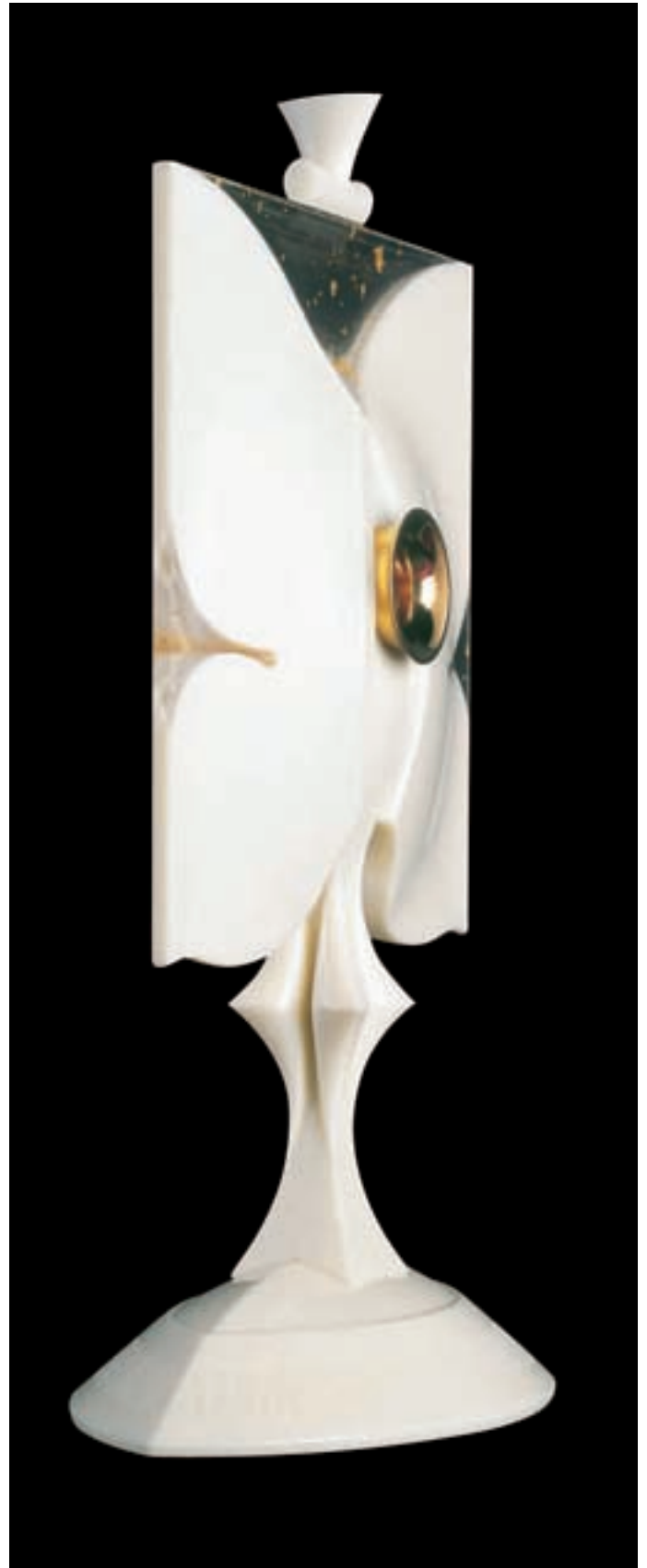
Slika 1: Relikviarij - celota. Plastičnost oblikovanja, ki jo pogojuje specifična raba, omogoča učinkovitost liturgične posode iz različnih zornih kotov. Reliquary - entity. The design's plasticity, which is conditioned by specific usage, enables efficiency of the liturgy vessel from various aspects.

Relikviarij fatimskih vidcev je nenazadnje droben, pa vendar prepričljiv izraz kakovostnega in učinkovitega sodelovanja med umetnikom, mojstrskimi znanji in proizvajalci sodobnih materialov ter naj sodobnejšimi tehnološkimi rešitvami na polju krščanske umetnosti, ki je zaradi njene specifične funkcije vedno posegala po najvišjih merilih.