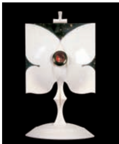
Slika 3: Poudarjena hierarhija med "očesom" z relikvijami in "avreolo". The hierarchy between the "eye" with the relics and aureole is emphasised.