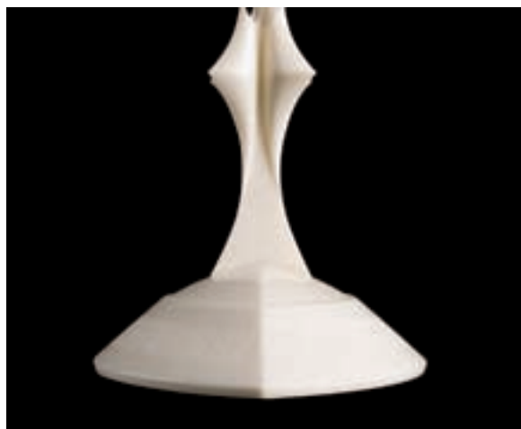
Slika 5: Stalce relikviarja z gravuro - značilno sestavino liturgičnega posodja. The reliquary's stand with its' engraving - a characteristic component of liturgy vessels.