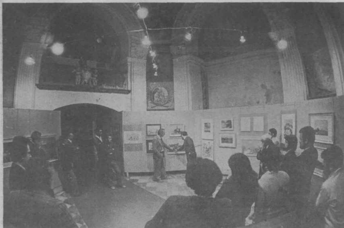
Takole so amaterski ustvarjalci sami razlagali, kaj so hoteli povedati, na kakšne težave so naleteli med delom in kje so njihove pomanjkljivosti, ki se jih ne znajo otresti spričo tega, ker nimajo strokovne podlage. Zato so prav taki kritični pomenki dobrodošli, predvsem zato, ker se ob ugotavljanju lastnih napak in napak drugih izpopolnjujejo in dopolnjujejo, kar jim bo v prihodnje močno koristilo, se zlasti zato, ker takšne pomenke strokovno vodi prof. Zahariaš. J. S.

Amatersko eksperimentalno gledališče v Mostah vjudno vabi k sodelovanju fante in dekleta, ki čutijo v sebi sposobnost in veselje do gledališkega dela. Prijavite se na naslov: ZKPO občine Ljubljana Moste-Polje, Ob Ljubljanci 42, telefon 43-277.