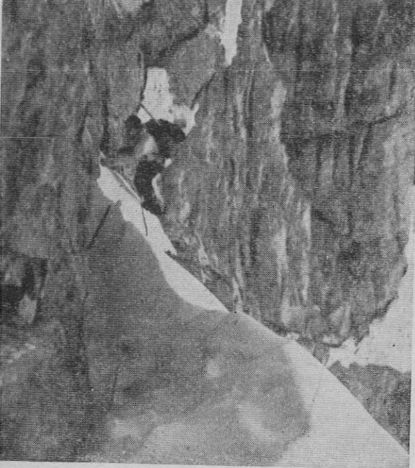
V snežni strmini nad „Hlebcí“

Povprečna naklonina stene Eigerja, po izjavi očividcev, odgovarja povprečni naklonini Zimmer-Jahnove smeri v triglavski steni. Seveda so tu izvzeti posamezni ledeni skoki v Eigerjevi steni, kot so na primer Hintersteusser-jeva prečka itd. Tako je strmina in izpostavljenost centralnega in zahodnega dela Triglavske stene mnogo večja. S tem lahko torej v precejšnji meri zamašimo vrzel, nastalo ob pomanjkanju karakteristične višinske razlike.