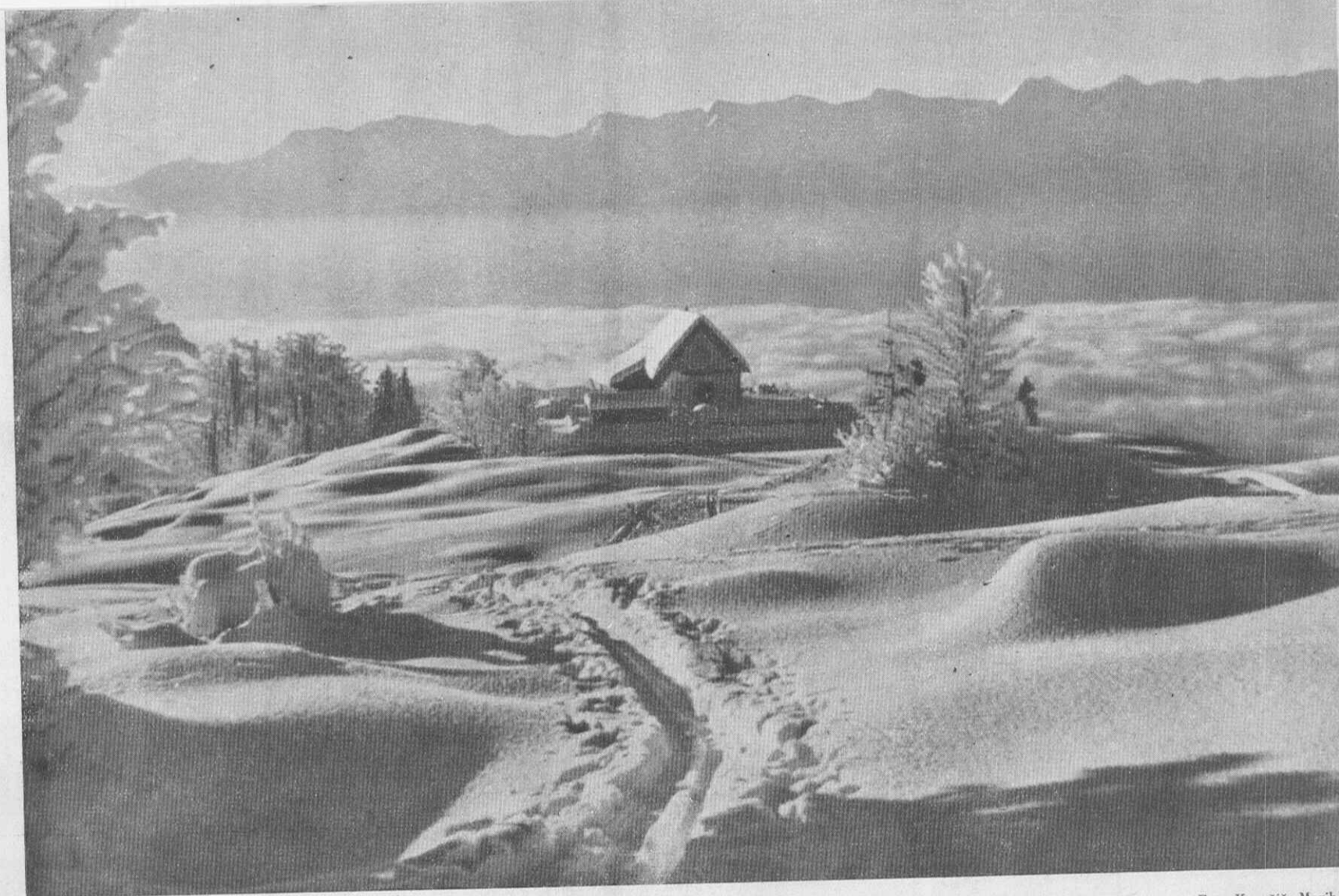
Novo leto na Uskovnici