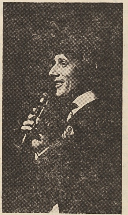
Za vse tiste, ki hočejo njegovo sliko izrezati: Udo.

Nastop slavnega popevkarja Uda Jürgensa v celovškem Mestnem gledališču, se je sprevrgel za umetnika v pravi pravcati triumf. Mladina mu je prirejala viharne aplavze. Prireditelj večera (pel je v četrtek, 15. maja) je bil kulturni referat mesta Celovca v sodelovanju z gledališčem. Čisti dobiček je namenjen za gradnjo koroške visoke šole.