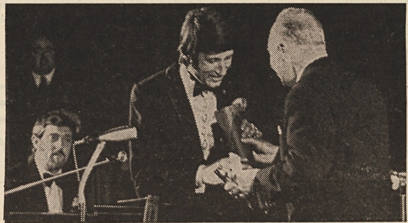
Po prireditvi v gledališču mu je mestna občina priredila svečan sprejem na magistratu.