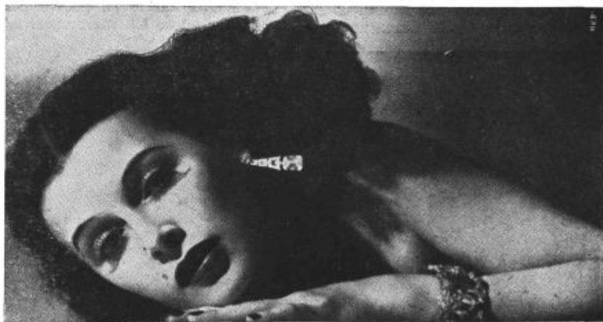
Hedy Lamarr v filmu »Alžir«. Kino Union.

Pred to uredbo so se leta 1934-35 izdelali razni načrti za izboljšanje ra-