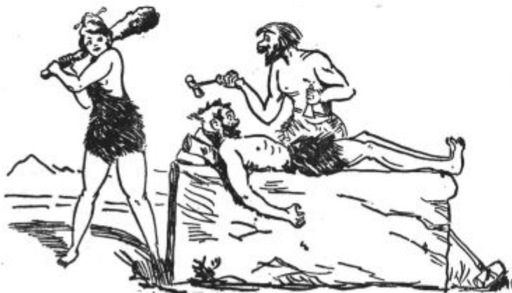
Operacija v kamni dobi.

20.00: Iz Bolgarije (plošče): Radojev: Bambina, tango. Georgijev: Aiša, slowfox. Narodna: Dotekla voda studena. Narodna: Stojno,