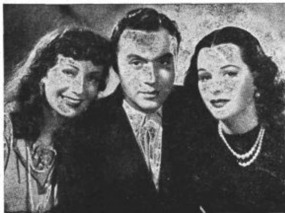
Trojica iz filma »Alžir«. Film ima na sporedu kino Union.

Brez dvoma je v razstavnem poslopju najprivlačnejša dvorana, v kateri so razstavljeni televizijski aparati. Televizija v Nemčiji in tudi drugod, zlasti v Ameriki in Angliji je v zadnjih letih zelo na-