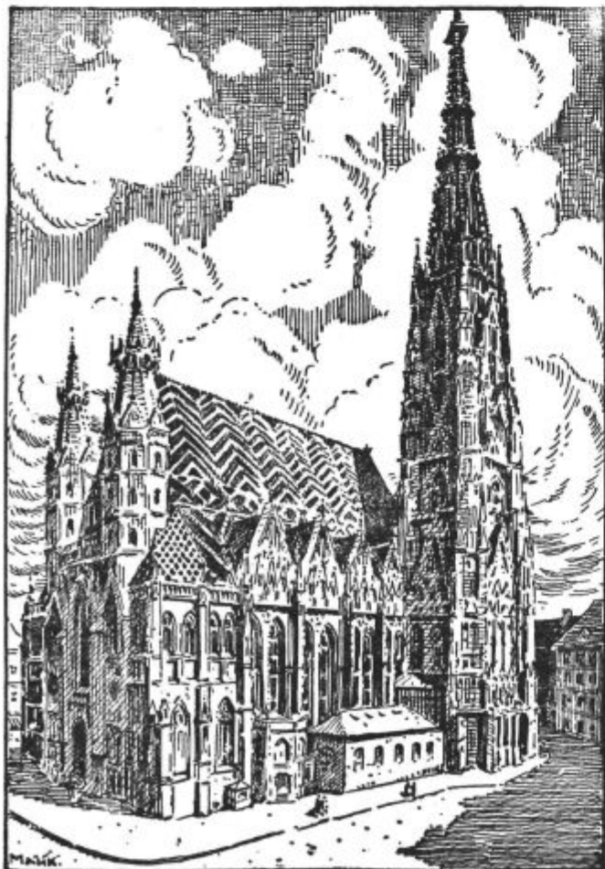
Cerkev sv. Štefana na Dunaju.

6.30 ●. 6.35 ○. 8 Angleška glasba. 10.45 ○. 11.25 Ženska ura. 12 Časopisne vesti. 12.05 ♪ orkestra Pensis. 12.50 ●. 13 Harmonike. 13.30 ●. 13.45 ♪ orkestra. 14.15 Angleška glasba. 19 ●. 19.10 Reklamni spored. 19.45 ♪ orkestra. 20 Reklamni ♪. 21 »Nonna«, opera. 22.30 ●.