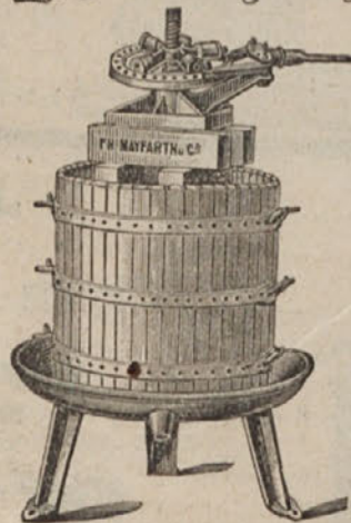
Stiskalnica za grozdje.

so naše „HERCULES“-stiskalnice najnoveje in najzvrstneje mehanske sestave z dvojnatin, vedno delujočim ritiskalom; zagotavlja se skrajna vporabljljivost, katere nadmašuje vse druge stiskalnice.