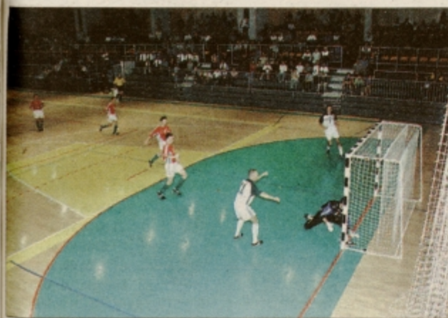
Utrinek s tekme.