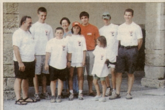
Švedrovci so se na Ptujju počutili lepo

Švedrovci so člani ene od družin iz omenjenega doma. To ime so si dali, ker so na svojih izletih in pohodih pošvedrali že marsikak čevlji. Doslej so obredli že kar lep kos Slovenije. Bili so v podzemskem svetu in na dvatisočakah, kolesarili do mor-