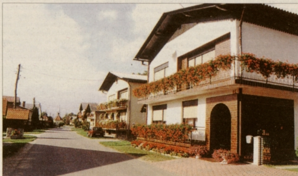
Center Starošinc, najlepše urejene vasi v občini Kidričevo v letu 2000, krasijo lepo urejene hiše

hovcah, Jablanah, Stražgonjci, Šikolah, Njivercah in Strnišču, po eno pa v Dragonji vasi in Spodnjem Gaju.