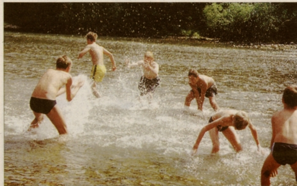
Prijetna osvežitev v Kolpi