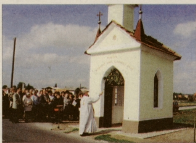
Blagoslovili so obnovljeno kapelo

Nedeljska slovesnost je bila za prebivalce tega kraja, ki so zelo povezani, pravi praznik. Številni obiskovalci so se najprej zbrali pred obnovljeno vaško kapelo, ki je posvečena sveti Družini. Tudi najstarejši občani se ne spomnijo, zakaj so jo predniki postavili, vedo le, da je stara okrog sto let in ves