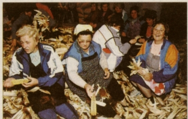
V skednju se je zbralo skoraj več kužuharjev, kot je bilo koruze