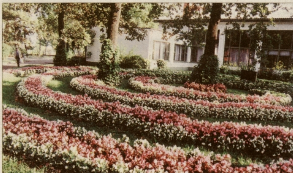
Med lokali je najlepše urejena restavracija PAN v Kidričevem s cvetočo okolico.

V občini Kidričevo so svečano proglasili najboljše urejene hiše, kmetije, bloke, lokale ter vasi v letošnjem letu. Proglasitev so opravili minulo nedeljo, 24. septembra, v Starošincih, prijazni vasi v osrčju Dravskega polja, ki jo je turistično društvo izbralo za najlepše urejeno vas v letu 2000. Najlepše urejenim so izročili zlate kostanjeve liste, ker pa so spoznali, da imajo veliko urejenih hiš, so podelili še 43 priznanj turističnega društva. Štirim krajevnim odborom pa so zaradi nekaterih neuglednosti podelili koprive; te opečejo, a tudi zdravijo.