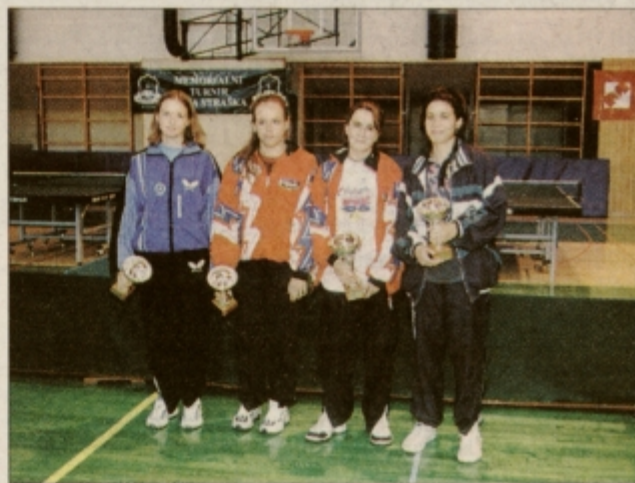
Najboljše pri dekletih.