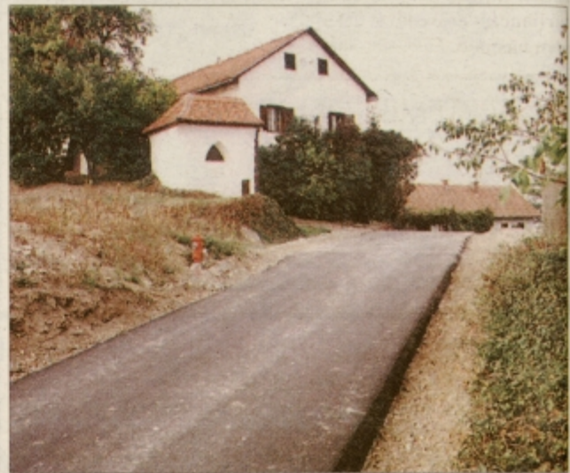
Haloška občina Zavrč je ob letošnjem prazniku bogatejša za blizu 5 km asfaltiranih cest

TEDNIK: Vse čestitke torej ob letošnjem občinskem pra-