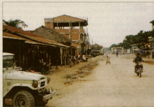
Mestece sredi velike džungle

šine do kraja Coroico v področje Jungas (pokrajina se deli na Ande = gorovje, Jungas = vmesni pas in na Selvo = pragozd). Vožnja je bila večkrat prekinjena z vojaškimi zaporami, saj je na območju Jungas večina kokinih dreves na svetu. Med vožnjo po cesti smrti nas je včasih omočil potok, ki si je udiral pot točno nad nami in nam potem