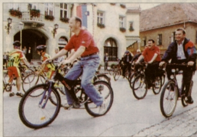
Pred začetkom ptujjske akcije evropskega dneva brez avtomobila.

tje nekaterih predelov, kot so to storili v drugih mestih, ker bi samo v tem primeru lahko udeleženci akcije v resnici prijetneje "doživeli" svoje mesto, kot je v vabilu za sodelovanje na dnevu brez avtomobila zapisal ptujjski župan. Zanimivo je tudi, da med petkovimi kolesarji ni bilo tistih, ki si ob vsaki priložnosti na glas prizadevajo za ureditev kolesarskih stez na Ptujju in okolici. Ne glede na obveznosti bi v petek morali biti zraven! Upamo lahko le, da bodo ptujjski mestni oblastniki glede na "ugotovitve" kratke simbolič-