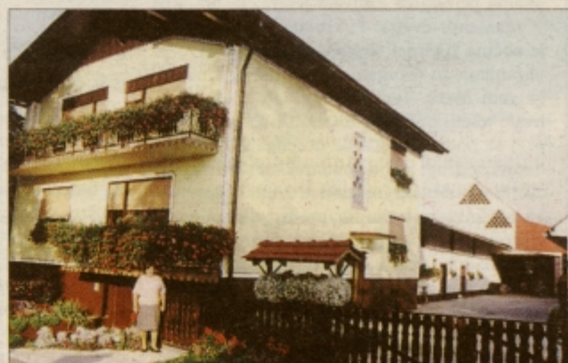
Mariča Belec pred svojo najlepše urejeno kmetijo v Župečji vasi 55