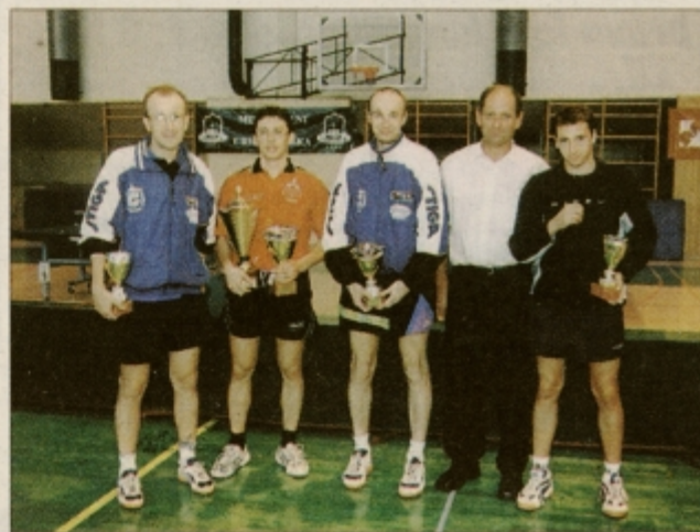
Najboljši pri fantih.