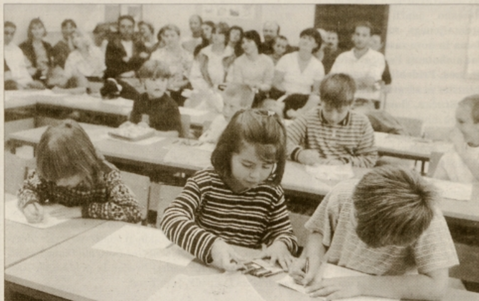
V prvem razredu osemletke sedemletni učenci sedijo v šolskih klopih in pridno rišejo.