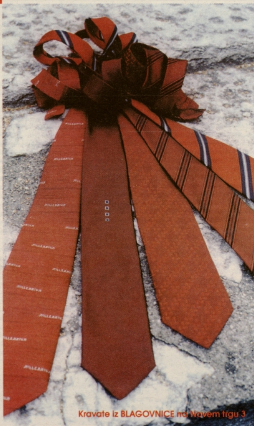
Kravate iz BLAGOVNICE na Novem trgu 3