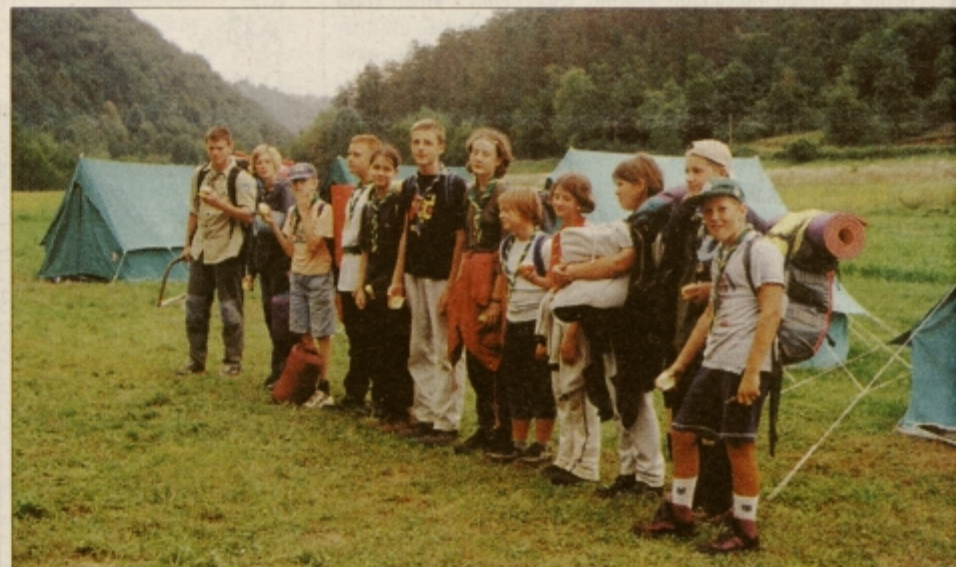
Odhod na bivakiranje je odhod v neznanu

Vsak večer so prižgali ogenj, ki je taborniška posebnost. Po-