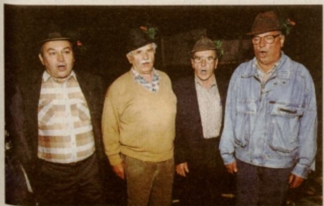
Hajdinski fantje so tudi tokrat pokazali, da znajo dobro peti.