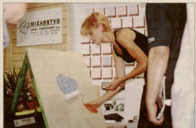
Tiste, ki se zanimajo za prenovno stanovanj, so na ptujskem razstavišču zanimali predvsem notranji tekstilni dekorativni ometi. Kot je bilo videti na demonstraciji, je njihov nanos zelo enostaven.