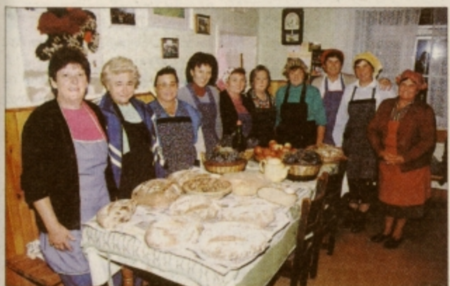
Bogato obložena miza je kar sama vabila.