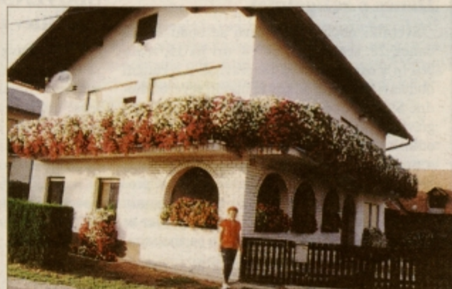
Anica Vrtnik pred najlepše urejeno stanovanjsko hišo v Cirkovcah 28