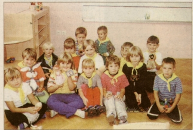
Z občinskim praznikom je povezan tudi praznik podružnične šole Zavrč, kjer imajo tudi že oddelek devetletkarjev

veda mislim na zaključek del na vodovodnem sistemu, na investicijo, vredno 180 milijonov tolarjev, pa tudi na 5,7 kilometra moderniziranih cest. Ta dela so občino veljala 110 milijonov tolarjev. Obe pomembni pridobitvi sta za našo občino izredno velikega pomena, še posebej v njem kratkem obdobju obstoja."