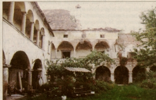
S koprivo so opekli tudi Kungoto za neugledno propadanje gradu Ravno polje.