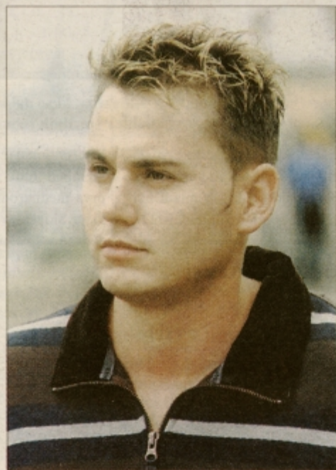
... in pozneje