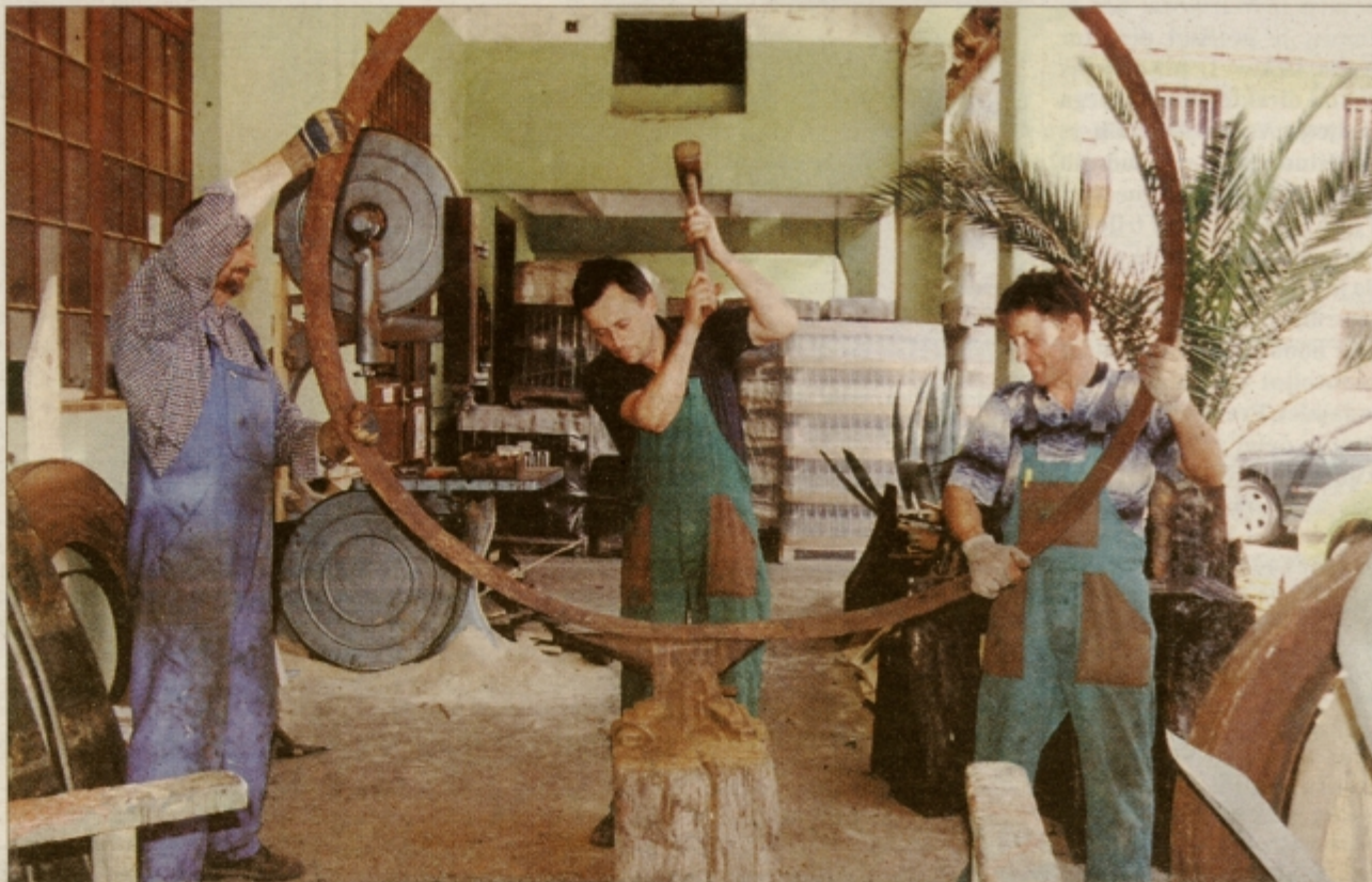
Kljub suši je nateklo mošta, da imajo sodarji v ptujski vinski kleti dela čez glavo.