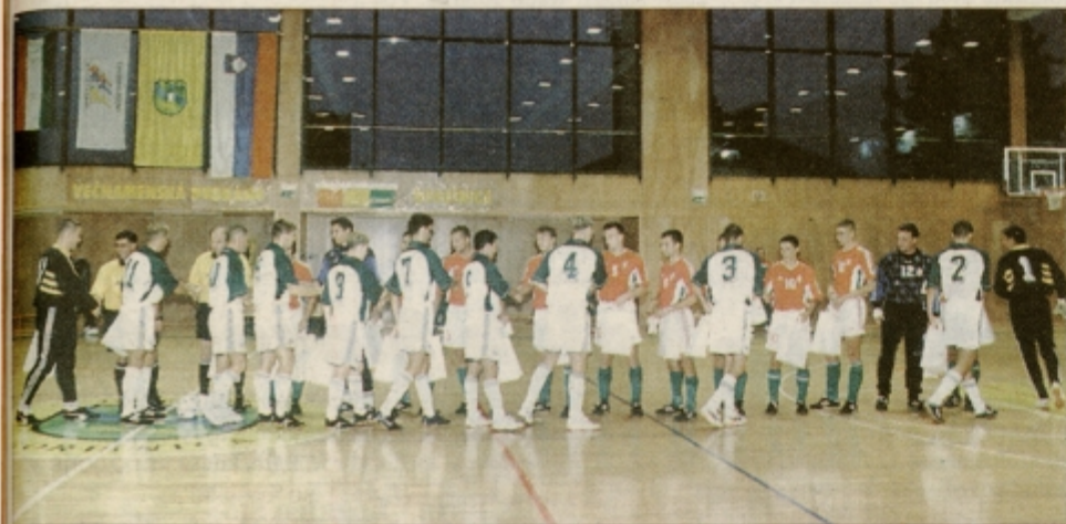
Slovenska in madžarska malonogometna reprezentanca