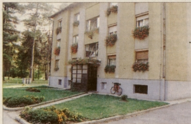
Najlepše urejen je blok v Kajuhovi 1 v Kidričevem

Poleg tega so za lepo urejenost hiš in okolice podelili še 43 priznanj turističnega društva. Največ, kar pet priznanj so podelili krajanom Lovrenca, štiri Apačanom, po tri so prejeli v Župečji vasi Pleterjah, Cirkovcah, Pongrcih, Starošincih, Kungoti, in Kidričevem, po dve v Mi-