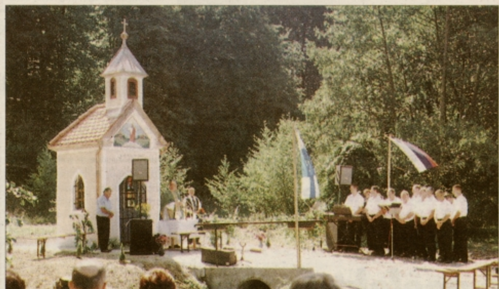
V Veličanah so krajanje postavili novo kapelo sv. Antona.