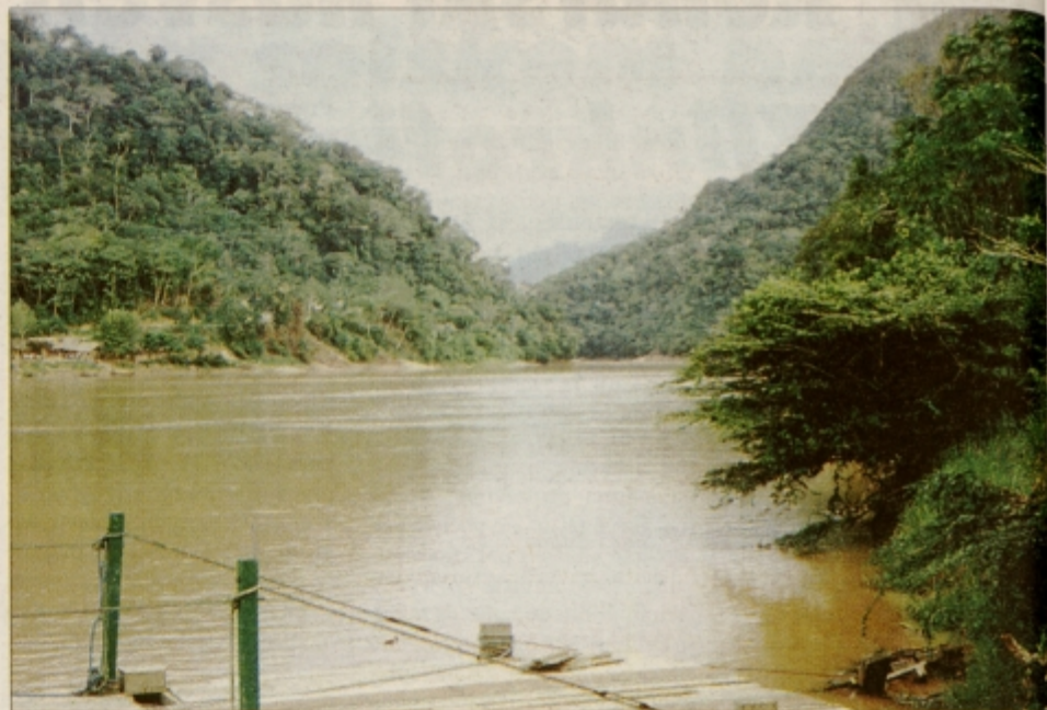
Rio Beni - ena od mnogih rek, vijugajočih se po deževnem pragozdu

Do zelenega Rurenabaque, kraja, ki je 450 km oddaljen od La Paza, sem po 19 urah vožnje prišel povsem izčrpan. V mestu s približno 1000 prebivalci, ki je povsem iz lesa in skozi kate-rega teče reka Rio Beni (eden izmed mnogih pritokov Amazonke), so najpopularnejše vožnje z motorji po vsega skupaj 500 m dolgi ulici. Te so očitno zadnji hit in prvi znaki vdora "zahodnopoestniškega." kapitala. Nebo, polno črnih mr-