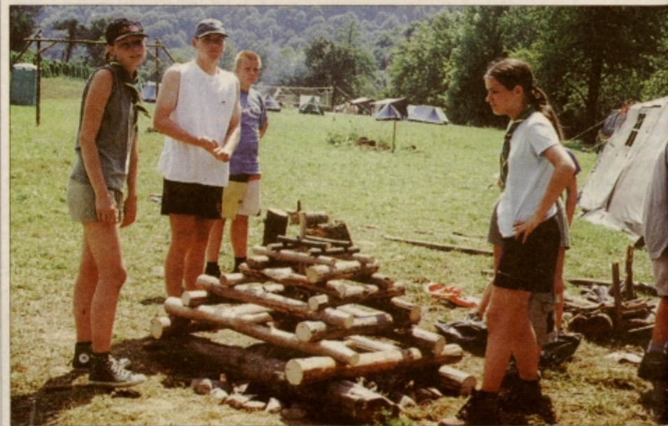
Fagoda je slavnostni ogenj in je v ponos tistim, ki jo postavljajo