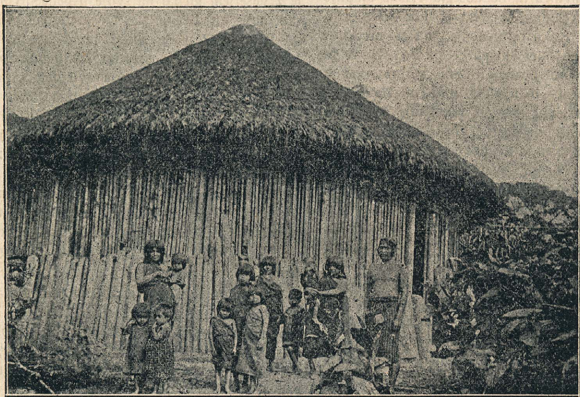
Koča divjakov Hivaros. (Ekvador)

Slika v glavnem oltarju nam predstavlja Jezusa z orodjem v roki. Za hip je Jezus mla-