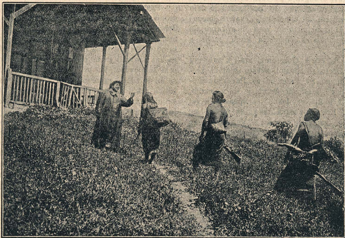
Divjaki obišejo sal. misijonarja.

Don Boscove sanje so danes izvršeno dejstvo. Hvalimo Boga, ki je njegovemu delu dal rast in blagoslov.