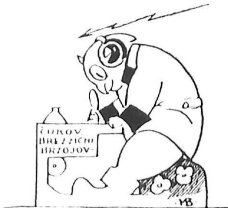
Goriča, dne 1. marca.

Nič kaj posebnega se ni zgodilo pri nas. Tisti, ki branijo, da bi drugi kaj napravili, niso napravili ničesar, in če so kaj napravili, so naredili tako, da drugi ne morejo proti temu nič narediti. Tako smo končno dosegli, da je največji mir in red v državi. Še kritizirati se ne sme, zalkaj na ta način se rušita mir in red. Čuk na palci pričakuje, da bo še smeli prepovedati. In če že ne bo prepovedan, ga bodo vsaj ločili v dva smeha: v proti državnega in v pravovernega. Prvega bodo zaprli in obglavili, drugega bodo pa obdavčili. Za vsak dovtip bo treba plačati poseben kolek. Če bo uveden kolek na vse vidne in nevidne predmete, predlaga »Čuk«, da se uvede še na človeške vetrove. »Čuk na palci«, potem šele boš drag!