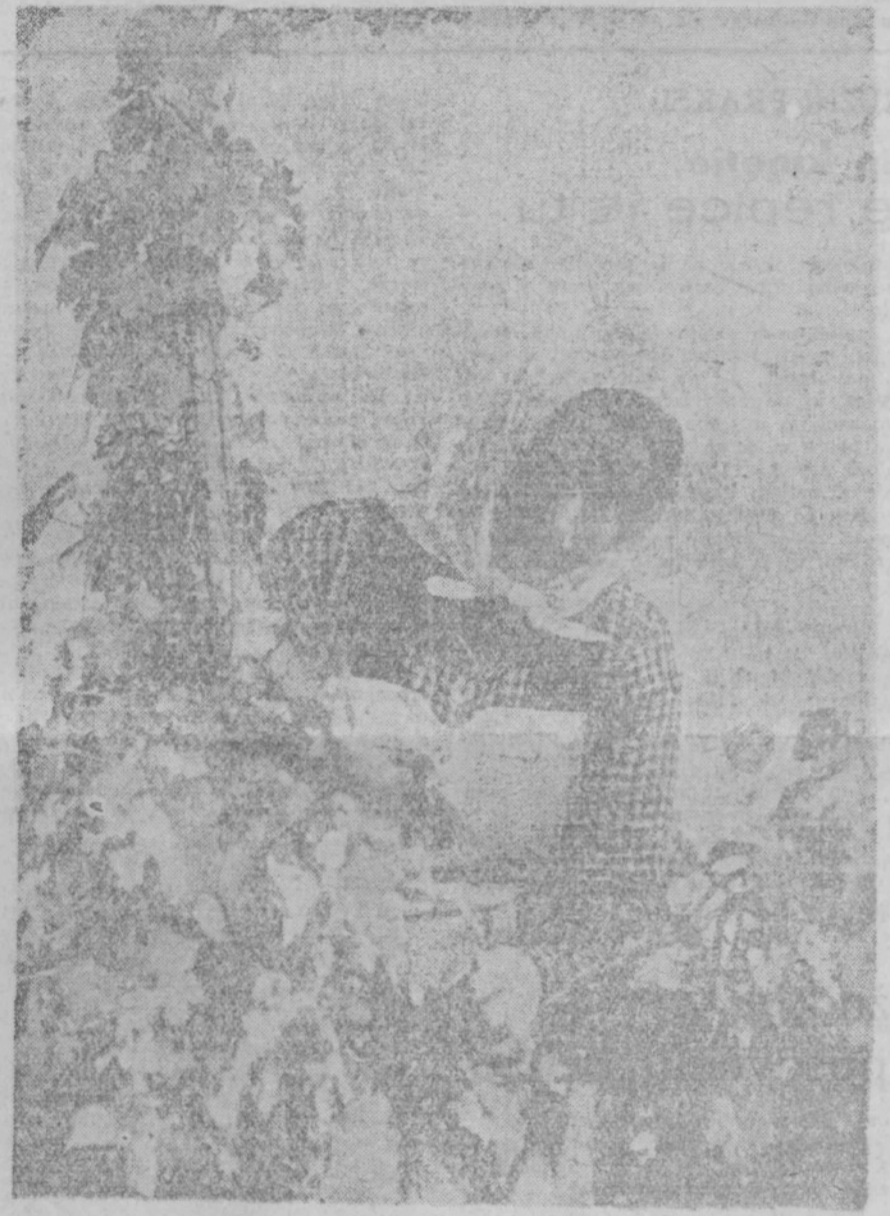
Tudi žene iz ptujskega okraja bodo obirale hmelj v Savinjski dolini