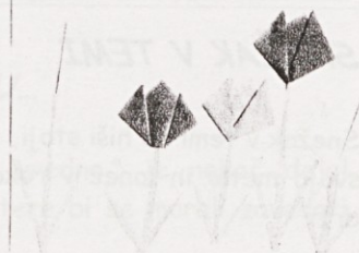
Gašper Kopše, 1.a