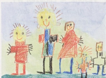
Miha Bedrač, 1.a