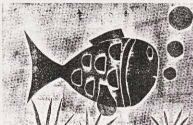
Beranič Mihael, 5.b