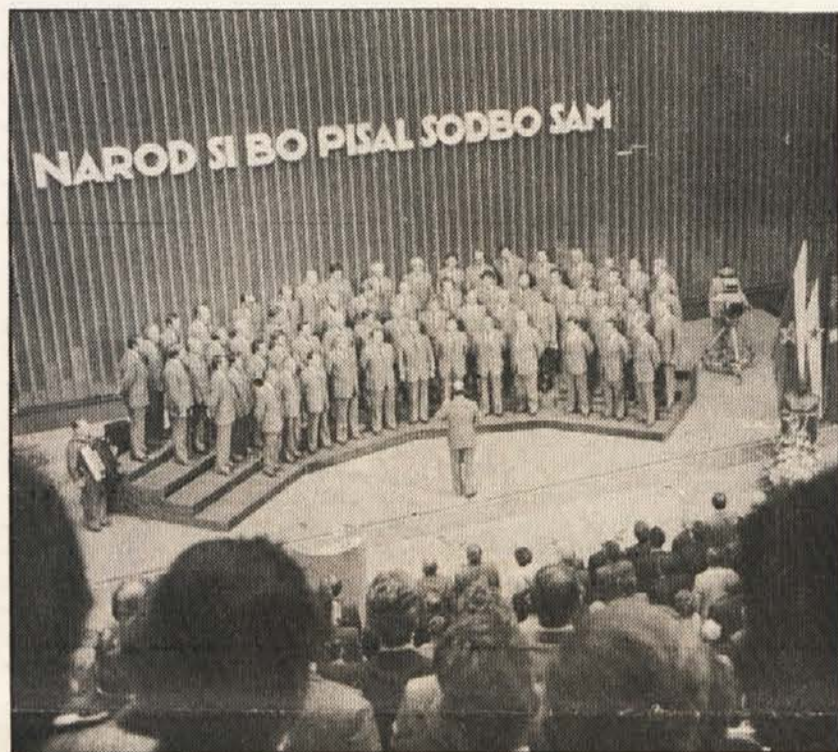
V Ljubljani so se s slavnostjo spomnili 40-letnice kočevskega zbora, prvega ljudskega parlamenta v zgodovini Slovenije.