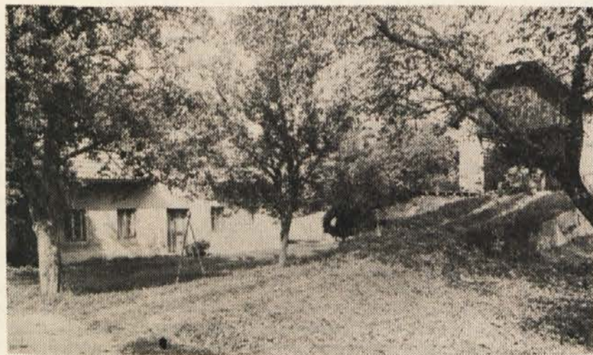
Vaška idila prikriva pomanjkljivo socio-ekonomsko strukturo in probleme, ki so z njo povezani

To dejstvo pogosto privede do odseljevanja, predvsem mlajših prebivalcev in mladostnikov. Domača občina izgublja privlačnost, ker