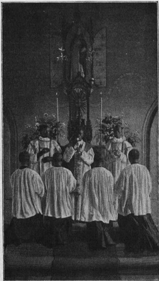
Zamorski duhovnik deli bogoslovcem sv. obhajilo.

drugih potreb je v misijonu, ki nam pridejo dnevno nasproti. Upamo, da ne boste pozabili na naš misijon Svetega Patricija.