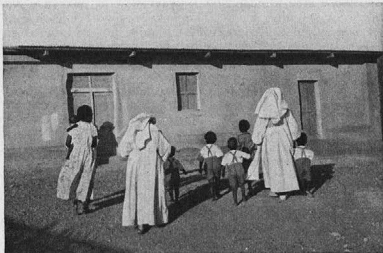
Misijonarke grejo z malimi zamorčki v cerkev.

Bogu, razen strahu ni bilo hudega. Morali smo hitro postaviti zasilno cerkev. Toda že za navadne nedelje je prostor premajhen, tako da mora večina ljudi ostati zunaj na soncu. Zato bi bilo treba pozidati novo cerkev.