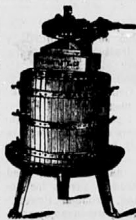
Stiskalnica za vino.

in za MASLINE so stiskalnice „ERCOLE“ najnovejšega in izvrstnega sestava s pristojem za dvostruki in trajni pritisk; zajamčena največja izraba, večja od vseh drugih stiskalnic; najboljše avtomatične škropilnice za trte patent.