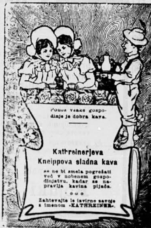
Povna vase gospodinjje je dobra kava.