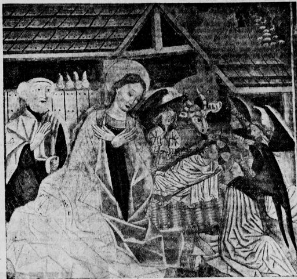
Freska Vincenca iz Kastva (Škrilje, Istra)

Vsi pa bomo v tem prazniku družinske povezanosti prosili, naj bodo naše družine zdrave, močne, polne otrok in polne božičnega pričakovanja in božičnega duha; v katerih naj vedno stoluje sveto Dete — Bog, ki naj varuje nesreč in bega v neznanu, in naj jim blagoslovlja domove, ter tudi v najskromnejše štalice prinese tople domačnosti. Tiste prave domačnosti, kakor je bila v temni betlehemske votlini, ko jo je razsvetlila božična zvezda in so tudi pastirčki imeli ob sebi Boga, pravega Boga, ki je najbednejšim še vedno najbližji.