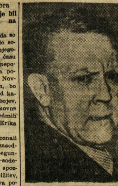
bo obsodba nad Quislingom po ljudskem mnenju izvršena v enem mesecu.