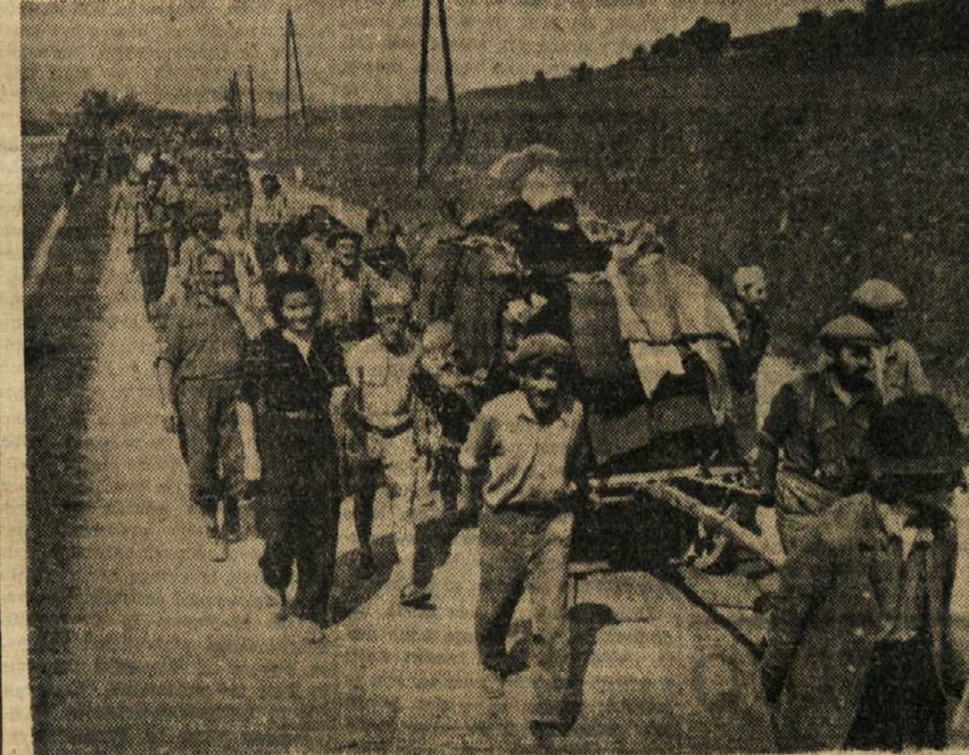
Del tisoč madžarskih beguncev, med katerimi je več kot polovica Židov, se vrača pod zavezniškim nadzorom zdaj spet na svoje domove. Nemci so jih prisilili, da so zapustili svoja bivališča v okolici Budimpešte.