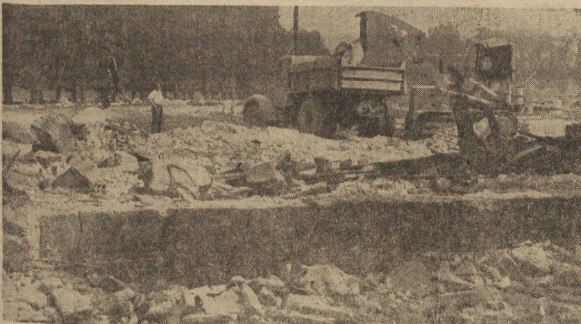
Starega velesajma ni več. Z vhoda v »našo občino« se je odprl pogled na Tivolski park, kjer bo osrednja jubilejna proslava na večer pred dnevom vstaje