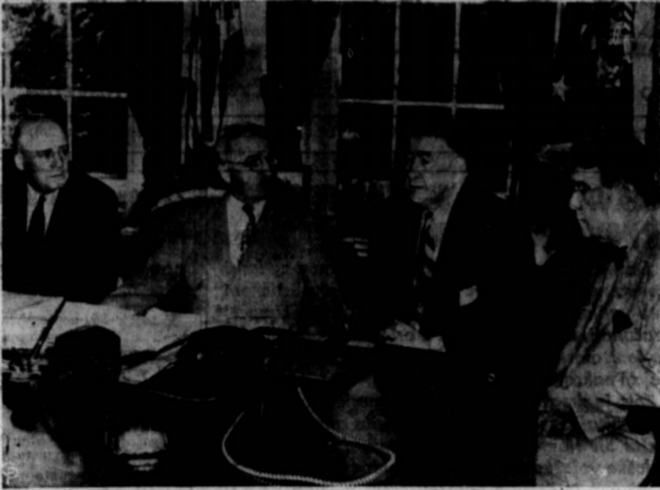
PREDSIEDNIK TRUMAN v zbornici nima posebne sreče s svojimi priporočili in predsednik unij CIO Philip Murray mu je v sredo 19. sept. vrgel očitek, da se je za delavstvo potegnil le navidezno, dočim ni na kongres napravil nikakršnega pritiska. Na sliki z leve na desno so predsednik poslanske zbornice Sam Rayburn, predsednik Truman, senator Alben Barkley in senčtor Kenneth McKellar.

Poudaril je, da je sloga mogoča edino, ako se socialisti in