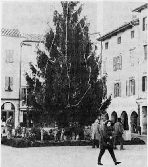
Pod velikim božičnim drevesu v Cedade so jaslica iz liesa

Pas al zive sele tle par nas, tu kajšni vasi, naše stare božične navade, al pa smo pozabil vse an tele dni, ki nas ločijo od Božiča lietamo napri an nazaj ku vsi, od dne butige do te druge, s trostan, de teli prazniki pridejo naglo h koncu? “Devetica”: al jo molejo se par kajšnim kraj? Za kar se nam da viedet, v Hrastovijem jo dielajo sele: vasnjani se od 16. dicemberja zbirajo vsako večer v kapelci na sred vasi za zmolit kupe rozar an zapiet cerkvene božične pjesmi.