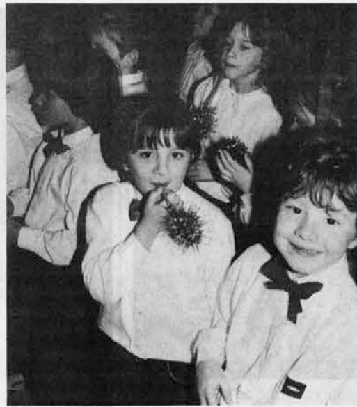
Due momenti dello spettacolo tenutosi domenica a San Leonardo dai bambini delle scuole elementari di S. Leonardo, Stregna e S. Pietro