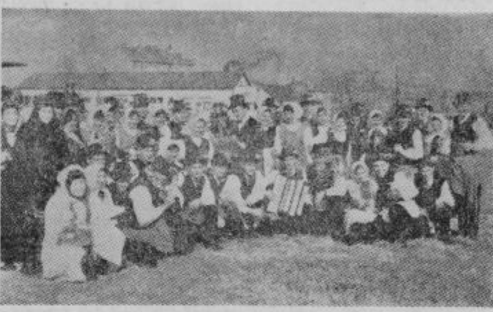
Ze vrsto let cirkovska folklorna skupina z uspehom nastopa na vseh večjih prireditvah v občini in izven nje

Po stranskih cestah vozijo pretežki tovornjaki, ki uničujejo ceste in mostove. Zgrajeni so le za manjša vozila. Vprašujejo, kako jih bodo popravili, ko bodo uničene. V Cirkovcih menijo, da mnoga podjetja njihove ceste le uporabljajo, za popravila pa se ne zmenijo. Med temi je KK Ptuj, ki bi lahko v zimskem času pomagal popraviti cesto Dragonja vas—Črna jama,