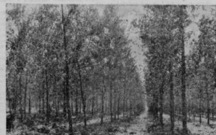
V ptujski občini je zasajenih že 180 ha topolovih plantaž

Prašičev zavarovalnica ne zavaruje za zdravljenje. V zadrugi bomo skušali uvesti interni sklad v ta namen. V sklad bi plačevali določeno vsoto po glavi živali.