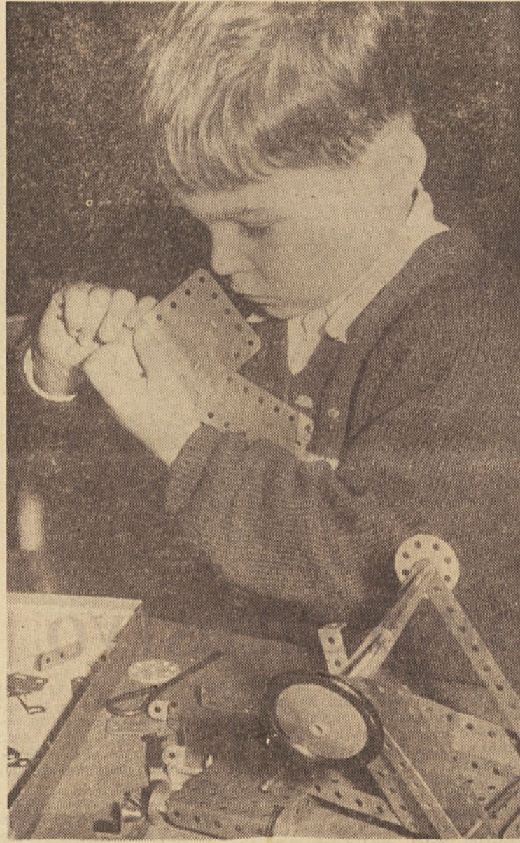
Bodoči strojni inženir? Morda...