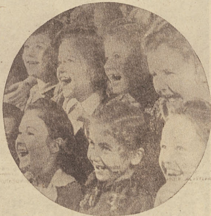
Otroško veselje v gledališču