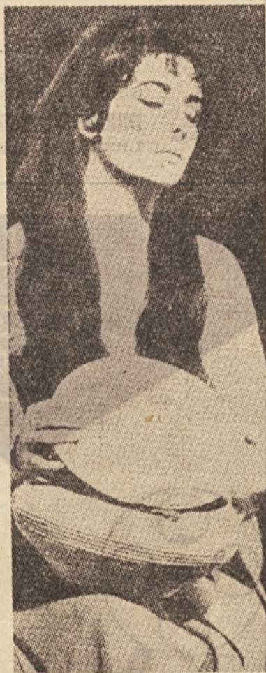
Iz ameriškega filma »Kleopatrina«: Elizabeth Taylor s košarico za kačo

Filmske predstave smo obiskovali enkrat mesečno; z upravnikom ptujskega kina sva izbirala