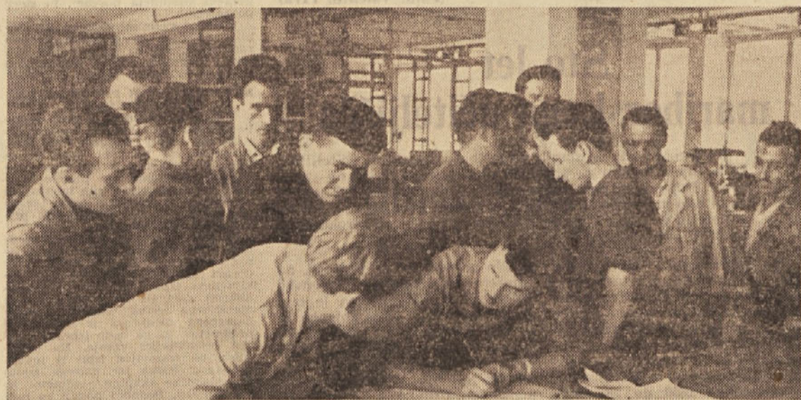
Vpisovanje ljudskega posojila v delovnih kolektivih (tovarna TOS)

Zveza prijateljev mladine Slovenije Sekretariat za šolstvo SR Slovenije Zveza pedagoških društev Slovenije