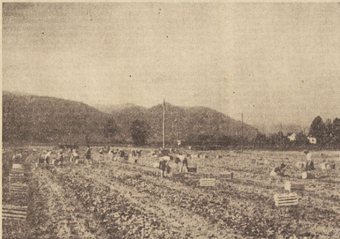
Dijaška skupnost gimnazije v Skofji Loki in tamkajšnje kmetijsko posestvo imata že več let nenapisan dogovor, da nudita pomoč drug drugemu. Dijaki pomagajo posestvu pri pospravljanju krompirja, ko je potreba po delovni sili največja, kmetijsko posestvo pa priskoči na pomoč s finančnimi sredstvi, zlasti, ko dijaki pripravljajo zaključno va uritetno ekskurzijo. Takšno sodelovanje med šolo in posestvom je tudi važen sestavni del delovne vzgoje mladine.

S. M. Željam se pridružuje tudi uredniški odbor Prosvetnega delavca, ki želi svojemu pravemu svetovalcu še mnogo plodnih let!