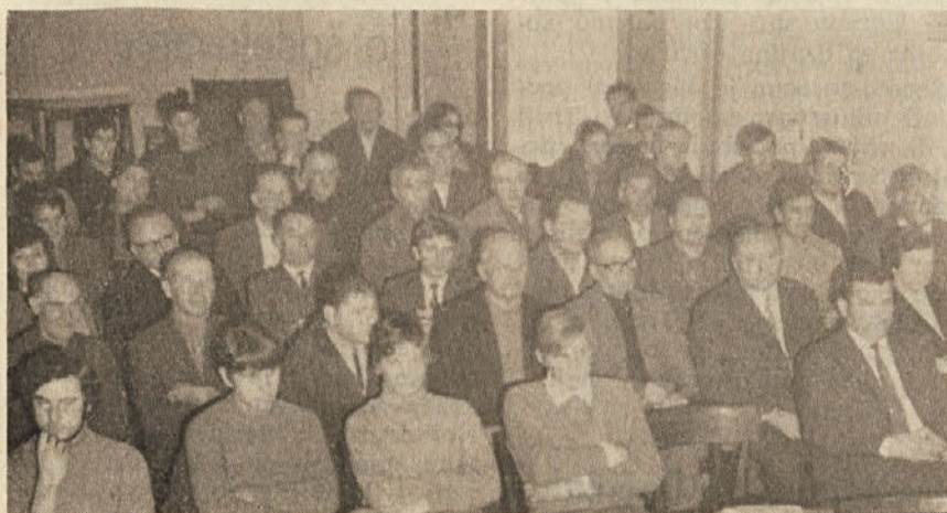
Občni zbor prosvetnega društva Valentin Vodnik v Dolini

mnoge nacionalistične in šovinistične organizacije v videmski, goriški in tržaški pokrajini. Iz nekega dokumenta je n. pr. razvidno, da je prejela «bonomianska» kmečka organizacija 748.500 lir «kot prispevek za politično dejavnost in obrambo italijanstva Nadiških dolin» (per azione politica difesa dell'italianità delle Valli del Natissone). Iz nekega drugega vira smo izvedeli, da je leta 1967 imel omenjeni «urad» na razpolago za podobne namene «samo» 120 milijonov lir.