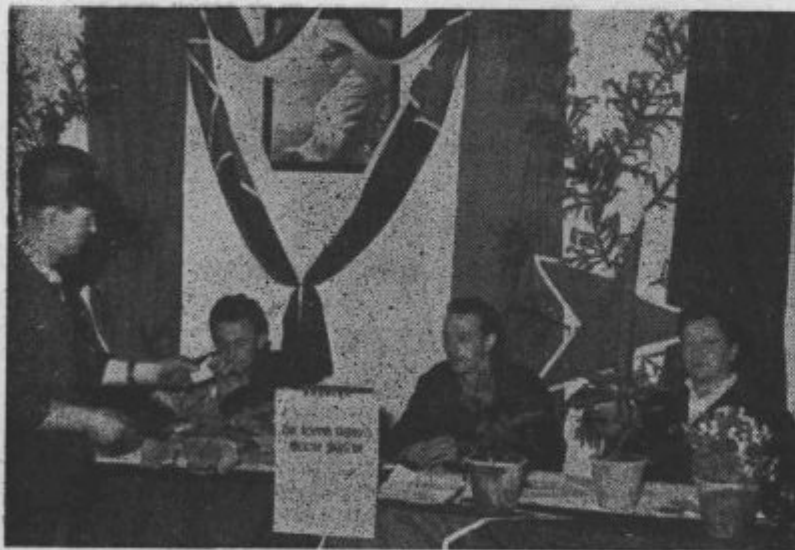
V našem podjetju smo v jutranjih urah volili v zbor delovnih skupnosti že skoraj vsi volivci.

OTROŠKO IGRISČE, ŠPORTNO IGRISČE IN KOTALKALIŠČE — VSE ZA NAŠE OTROKE!